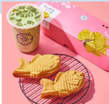
Gambar 2.5 Taiyaki dan Matcha Ladybee Taiyaki

Target market yang dituju merk ini adalah orang-orang berumur 17-25 tahun dengan SES B. Selain menjual produk/ barang, PT Tahoe Pranata juga kuat dalam menjual jasa franchise . Meskipun menjadi merk yang tergolong baru dalam pembentukannya, Ladybee Taiyaki tetap bisa berjaya. Pasalnya, franchise Ladybee sudah berhasil membuka lebih dari 10 cabang di berbagai kota di Indonesia. Brand Ladybee Taiyaki sempat viral dan cukup dikenal di Surabaya. Saat ini, Ladybee Taiyaki memiliki cabang outlet di Surabaya, Depok, Jambi, Bontang, Muara Enim, Pangkal Pinang dan Jakarta.