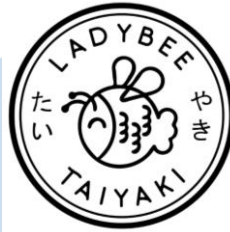
Gambar 2.4 Logo Ladybee Taiyaki

Target market yang dituju merk ini adalah orang-orang berumur 17-25 tahun dengan SES B. Selain menjual produk/ barang, PT Tahoe Pranata juga kuat dalam menjual jasa franchise . Meskipun menjadi merk yang tergolong baru dalam pembentukannya, Ladybee Taiyaki tetap bisa berjaya. Pasalnya, franchise Ladybee sudah berhasil membuka lebih dari 10 cabang di berbagai kota di Indonesia. Brand Ladybee Taiyaki sempat viral dan cukup dikenal di Surabaya. Saat ini, Ladybee Taiyaki memiliki cabang outlet di Surabaya, Depok, Jambi, Bontang, Muara Enim, Pangkal Pinang dan Jakarta.