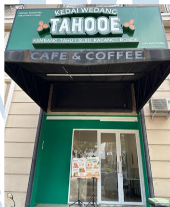
Gambar 2.7 Outlet Kedai Wedang Tahoe di Green Lake City

Kedai Wedang Tahoe dan Ladybee Taiyaki masing-masing dijual dalam bentuk franchise pada mitra. Terdapat 2 macam paket kemitraan yaitu autopilot dan non-autopilot. Kedai Wedang Tahoe menawarkan 1 paket kemitraan autopilot dengan harga Rp 88 juta. Saat ini, Kedai Wedang Tahoe memiliki 1 cabang di Green Lake City, Tangerang.