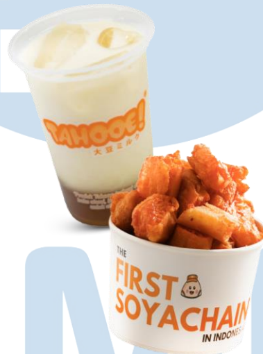
Gambar 2.3 Klasik Soya dan Cakwe Balado

Kedai Wedang Tahoe adalah merk pertama yang masih dipertahankan hingga sekarang karena Trio Sim percaya bahwa rasa tradisional harus dilestarikan di Indonesia. Target market yang dituju merk ini adalah orang-orang berumur 25-45 tahun dengan SES B. Cabang Kedai Wedang Tahoe hanya ada satu yaitu di Green Lake City, Tangerang. Perusahaan juga sedang mengupayakan penjualan franchise Kedai Wedang Tahoe.