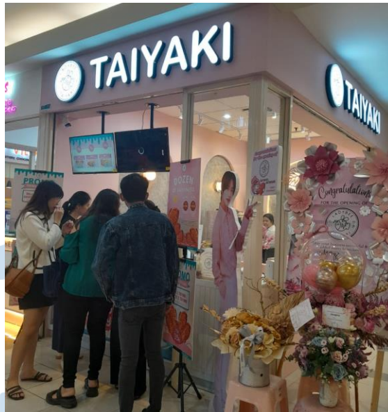
Gambar 2.8 Outlet Ladybee Taiyaki di Royal Plaza, Surabaya