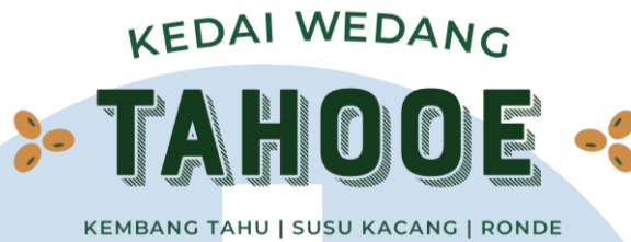
Gambar 2.2 Logo Kedai Wedang Tahoe

Kedai Wedang Tahoe adalah merk pertama yang masih dipertahankan hingga sekarang karena Trio Sim percaya bahwa rasa tradisional harus dilestarikan di Indonesia. Target market yang dituju merk ini adalah orang-orang berumur 25-45 tahun dengan SES B. Cabang Kedai Wedang Tahoe hanya ada satu yaitu di Green Lake City, Tangerang. Perusahaan juga sedang mengupayakan penjualan franchise Kedai Wedang Tahoe.