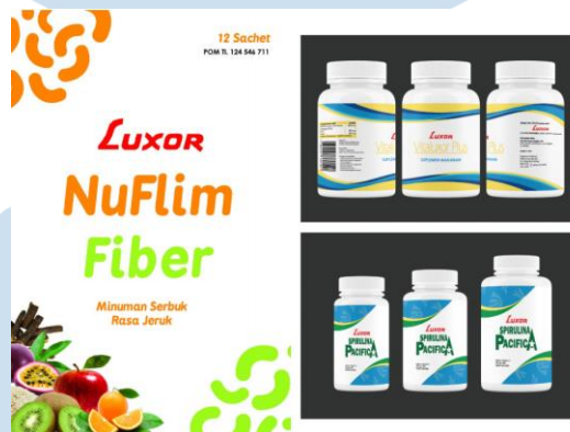
Gambar 2.7 Portofolio Perusahaan, PT Luxor Indonesia

Luxor merupakan perusahaan multi-level yang berfokus pada produk kesehatan. Pada proyek ini, output yang dihasilkan berupa re-desain 6 buah kemasan dengan tujuan agar produknya lebih menarik bagi audiens anak-anak. Kemasan produk ini dirancang ulang oleh Bekantan Creative dengan mempertimbangkan tren desain terbaru agar sesuai dengan generasi muda. Hal itu diwujudkan dengan cara membuat tampilan brand yang menyenangkan, original, dan dinamis.