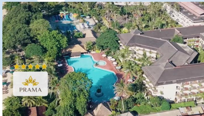
Gambar 2.5 Portofolio Perusahaan, Aerowisata Hotel & Resort

Pada tahun 2020, Bekantan Creative mendapat kesempatan untuk bekerjasama dengan PT Aero Wisata yang menjadi bagian penting dari Grup Garuda Indonesia dalam sektor pariwisata Indonesia. Output yang diciptakan membuat sepuluh video yang menampilkan berbagai lini bisnisnya, yang mencakup layanan makanan, perjalanan, transportasi, dan hotel kedalam satu video yang menggabungkan seluruh aspek ini.