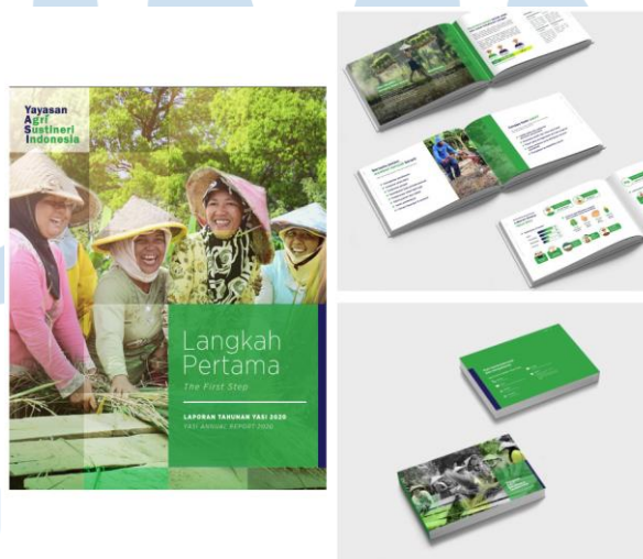
Gambar 2.4 Portofolio Perusahaan, Yayasan Agri Sustineri Indonesia