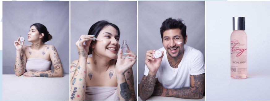
Gambar 2.3 Portofolio Perusahaan, LOY Beauty Cream

Pada project ini, Bekantan Creative bekerja sama dengan influencer Loriana Armanasco dan rekannya untuk mengembangkan merek produk mereka. Produk yang mereka jual telah disetujui dan diuji oleh BPOM untuk memastikan keamanannya. Dalam kerjasama ini, Bekantan Creative memberi output berupa foto produk yang digunakan untuk keperluan promosi hingga e-commerce.