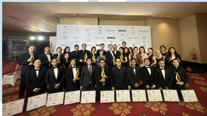
Gambar 2.4 Awarding Asia Property Award 2023

merupakan salah satu ajang bergengsi dalam real estate yang diadakan setiap tahun sejak 2015. Dalam gelaran tahun ini, Sinar Mas Land berhasil mendapat penghargaan Best Developer, Best Lifestyle Developer, Best Mega Township Development, Best Wellness Residential Development dan beberapa lagi. Sinar Mas Land akan terus berusaha untuk menjadi standar dalam pengembang properti.