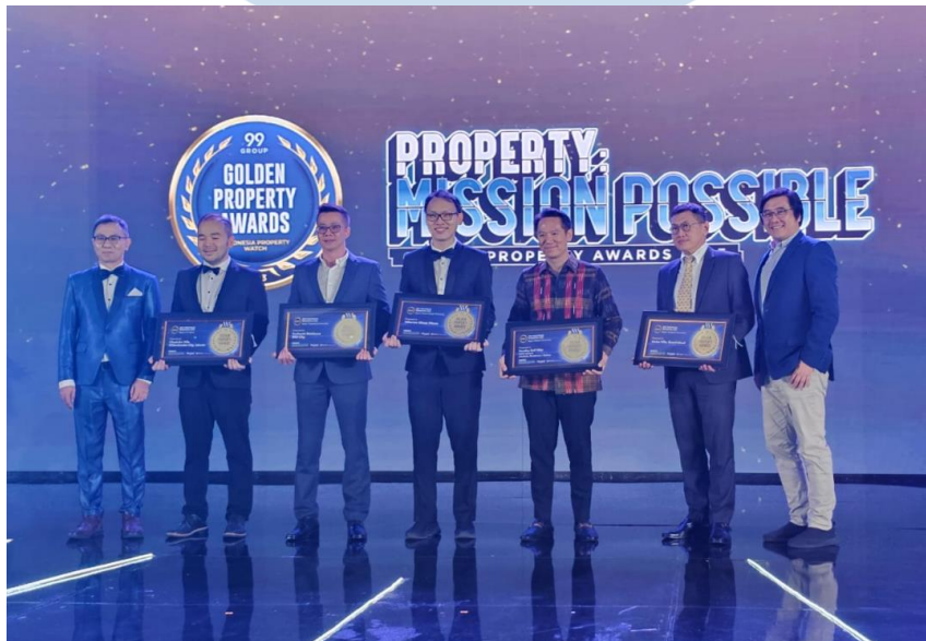
Gambar 2.3 Awarding Property Mission Possible 2023

Sinar Mas Land berhasil meraih beberapa penghargaan dalam event Golden Property Awards 2023. Golden Property Awards merupakan sebuah ajang yang diselenggarakan oleh Indonesia Property Watch dan kali ini bertemakan Mission Possible. Dalam gelaran tahun ini, Sinar Mas Land berhasil mendapat penghargaan Best of the Best City Scale Development, Best of the Best Prestigious Residential, Best of the Best Millennial Residential, Best City Scale Development Region Tangerang & Surrounding, Best Compact Scale Development Region Tangerang & Surrounding dan banyak lagi. Sinar Mas Land berharap akan terus berinovasi dan menjadikan awards ini sebagai dorongan semangat untuk kedepannya.