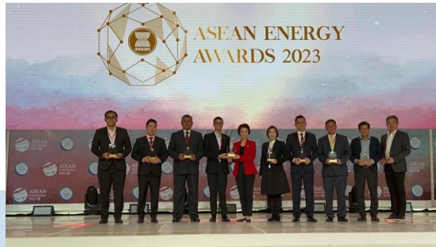
Gambar 2.5 Awarding ASEAN Energy Awards 2023