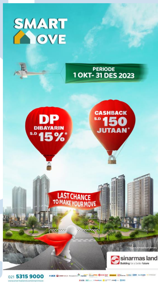
Gambar 2.7 Poster Program Smart Move

PT Sinar Mas Land menghadirkan program Smart Move yang merupakan Program Penjualan Nasional dari Sinar Mas Land. Program ini berlangsung dari bulan Februari – Desember 2023. Dalam program ini dibagi menjadi 3 phase yaitu smartmove 1, smartmove 2 dan smartmove 3. Sinar Mas Land mempromosikan program Smart Move secara gencar, mulai dari berbagai post media sosial hingga event. Program Smart Move dapat ditemui dalam event-event besar seperti Gaikindo Indonesia International Auto Show (GIAS), Indonesia International Pet Expo (IPE), BCA Expo dan berbagai pameran dalam ranah BSD City.