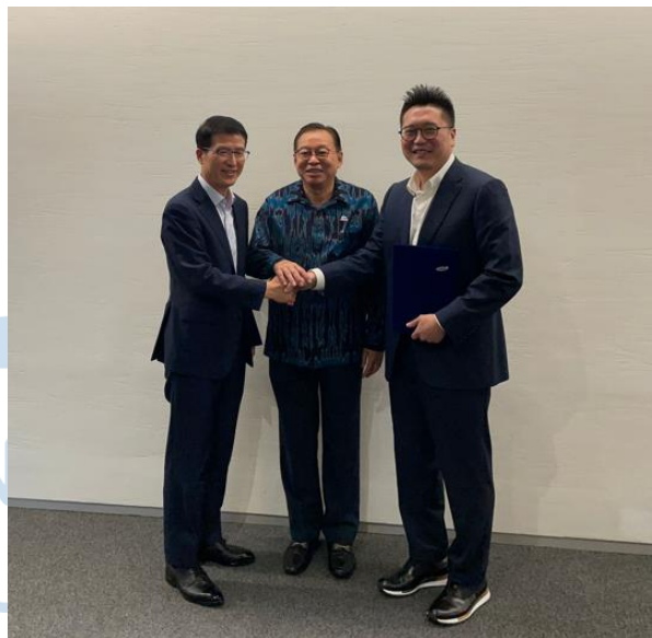
Gambar 2.6 Pihak Sinar Mas Land bersama Samsung C&T

PT Sinar Mas Land Bersama Samsung C&T Berkolaborasi Kembangkan Smart City di BSD City guna memajukan program integrated smart digital city. Untuk mewujudkannya, Sinar Mas Land secara resmi telah menjalin kemitraan strategi dengan Samsung, salah satu perusahaan global dan konglomerasi terbesar di Korea Selatan. Melalui anak perusahaannya, Samsung C&T Engineering & Construction Group (Samsung C&T-E&C Group), kolaborasi ini ditujukan untuk mendorong pengembangan kota pintar di Indonesia.