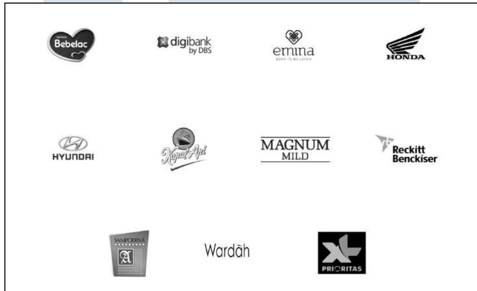
Gambar 2.3 Klien PT. Havas Group Indonesia

inovatif yang mencari cara untuk memasarkan produk baru mereka dengan baik, hingga perusahaan besar yang ingin memperkuat identitas merek mereka di pasar global.