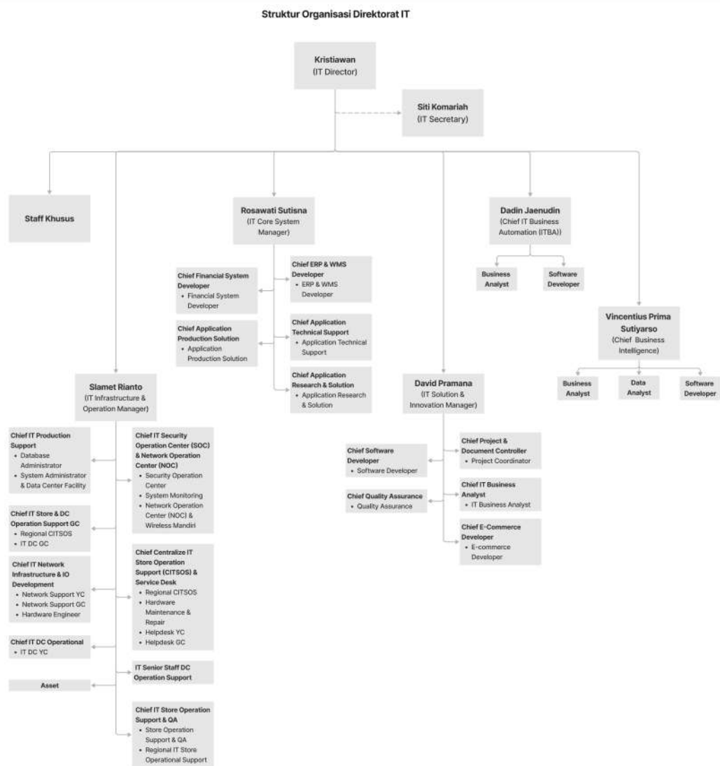
Gambar 2.2 Bagan Struktur Organisasi Divisi IT PT. Akur Pratama

Dalam pengembangan dan operasionalnya, PT. Akur Pratama dipimpin oleh Managing Director. Kemudian pada setiap divisi yang ada di PT. Akur Pratama ini dipimpin oleh para direksi yang kemudian terbagi lagi menjadi beberapa tim lainnya. Dari para tim ini pun dibagi lagi menjadi beberapa bagian yang tetap dipimpin oleh para chief dari setiap tim. Berikut adalah struktur organisasi divisi IT yang ada di PT. Akur Pratama: