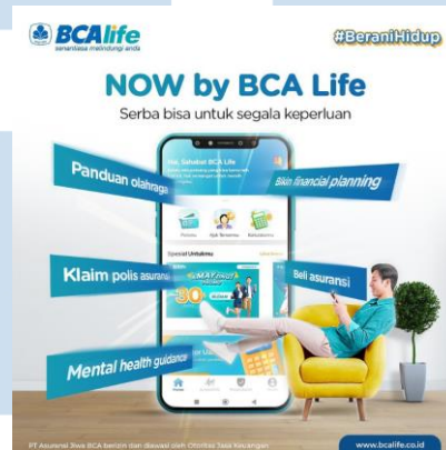
Gambar 2. 7 Aplikasi Now by BCA Life

penghitungan premi, fitur Active NOW untuk beragam inspirasi olahraga, katalog produk di fitur Protect NOW , dan informasi-informasi lainnya berupa artikel. Aplikasi NOW juga dapat menjawab berbagai pertanyaan seputar kebutuhan asuransi dengan fitur Pusat Bantuan.