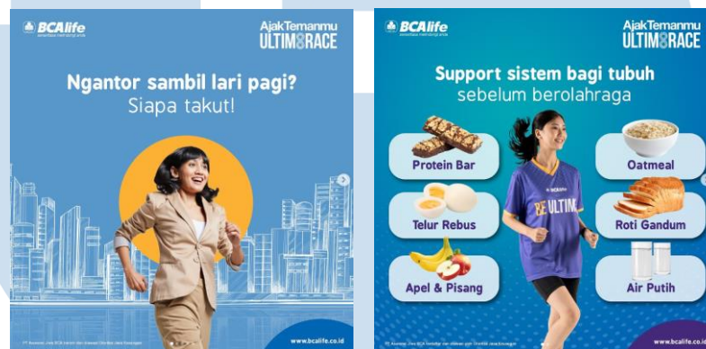
Gambar 2. 9 Ultima Race

Ultima Race 2022 merupakan rangkaian acara virtual run yang digelar pada tanggal 16 Juli – 3 Agustus 2022. Setiap peserta diberikan kebebasan untuk dapat berlari kapanpun selama periode tersebut dengan tantangan sejauh 8 kilometer. Setiap finisher akan mendapatkan kesempatan hadiah bernilai ratusan juta rupiah. Acara ini berhasil diikuti oleh sekitar 7 ribu peserta.