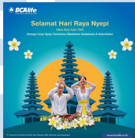
Gambar 2. 13 Greeting Hari Raya Nyepi

Sebagai wujud kehadiran bagi masyarakat Indonesia, tidak lupa dalam peringatan hari raya baik yang kecil maupun besar BCA Life memberikan ucapan selamat, doa, maupun harapannya. Setiap desain ucapan yang telah terpilih merupakan representasi ekspresi dari perusahaan kepada masyarakat secara umum sehingga diharapkan dapat mempererat dan memperdalam tali persaudaraan.