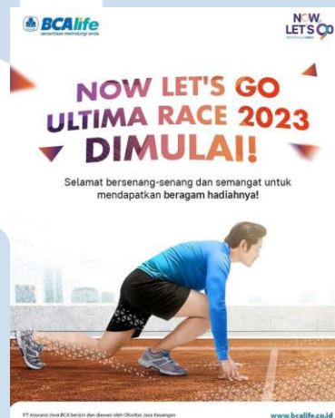
Gambar 2. 6 Desain NOW Let's Go Ultima Race 2023

BCA Life mengadakan virtual walk untuk merayakan hari ulang tahun ke-9. Acara ini memiliki tujuan untuk mendorong dan menginspirasi masyarakat Indonesia agar memiliki gaya hidup sehat serta aktif. Peserta dapat berjalan maupun berlari sejauh 9-kilometer dan menyelesaikan tantangan workout selama 16 hari pada aplikasi NOW by BCA Life. Acara dibuka untuk umum dan gratis. Peserta dapat juga menggunakan aplikasi GERAK atau Strava/Garmin. Setiap finisher berkesempatan mendapatkan beragam hadiah menarik.