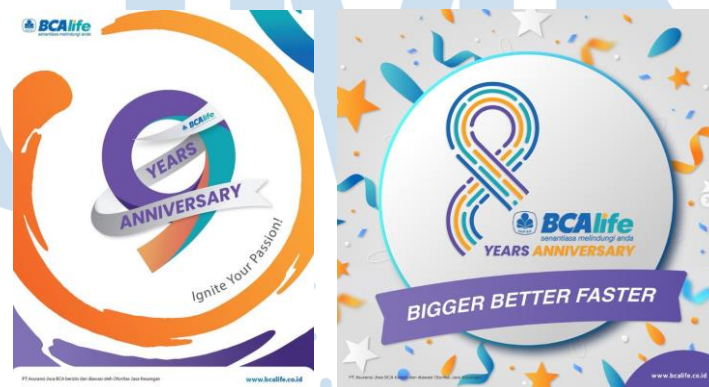
Gambar 2. 8 Anniversary of BCA Life

BCA Life sebagai satu-satunya anak perusahaan asuransi jiwa dari Grup BCA telah dipercayai oleh masyarakat untuk terus memberikan pelayanan sudah 9 tahun lamanya. BCA Life akan terus meningkatkan pelayanannya dan berinovasi bagi masyarakat Indonesia. Banyak rangkaian event dan promo menarik yang dapat diikuti pada hari ulang tahun BCA Life ini.