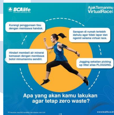
Gambar 2. 10 Virtual Race

BCA Life mengadakan acara virtual run yang mengajak masyarakat untuk dapat tetap berolahraga walaupun dalam kondisi pandemi COVID-19. Sejatinya dengan berolahraga rutin, tubuh kita akan memproduksi hormon endorphin yang memberikan rasa semangat dan dorongan positif. Dalam acara ini, peserta dibebaskan untuk memilih aktivitas olahraga seperti apa yang ingin dilakukan, seperti lari, jogging , jalan, maupun olahraga menggunakan treadmill . Acara ini berkolaborasi dengan aplikasi Gerak sehingga terbuka untuk umum, gratis, dan memberikan banyak hadiah menarik untuk masyarakat dapat ikuti.