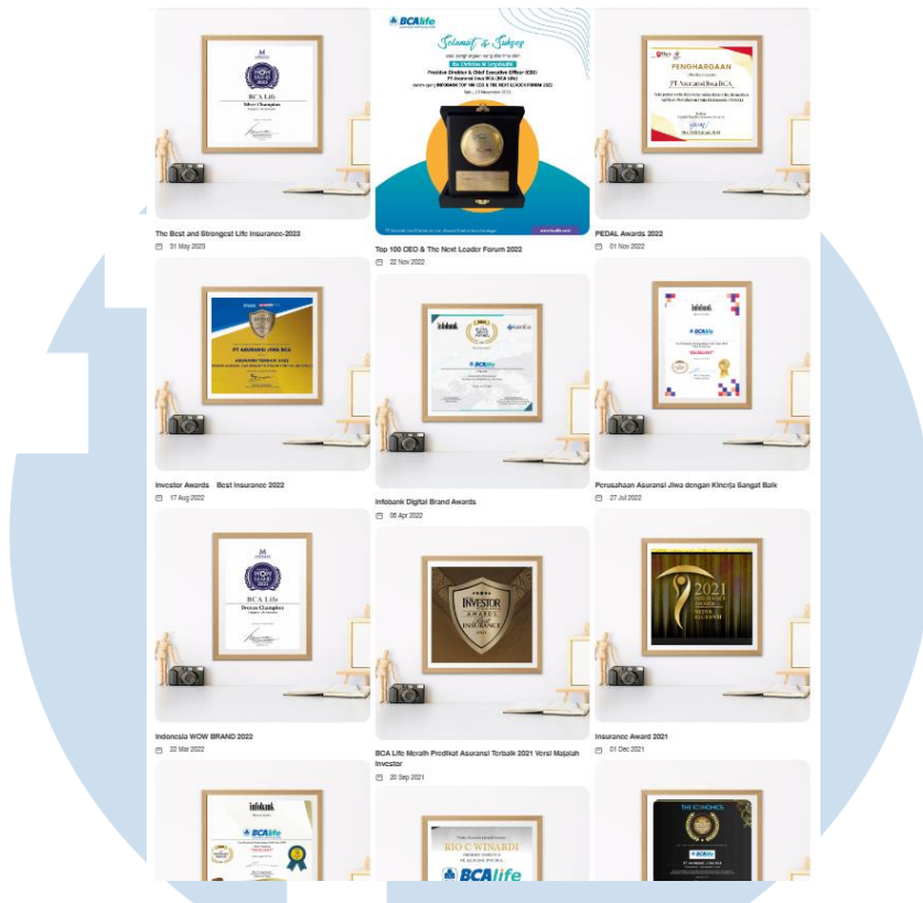
Gambar 2. 4 Penghargaan PT Asuransi Jiwa BCA