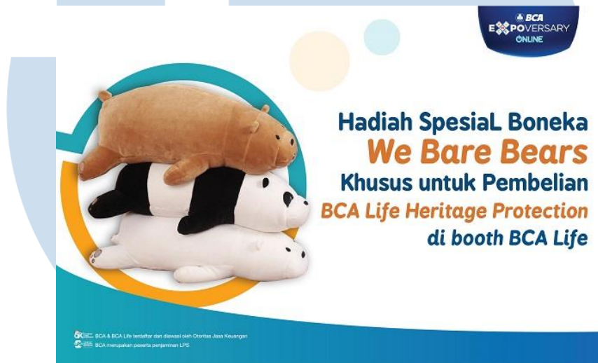
Gambar 2. 11 Promosi BCA Life di Expoversary

BCA mengadakan expo secara virtual pada tanggal 27 Februari hingga 27 Maret 2021. Acara ini sukses dilaksanakan berkolaborasi dengan developer property dan brand otomotif. BCA Life hadir untuk memberikan ragam layanan solusi perlindungan baik bagi individu maupun korporasi.