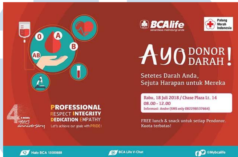
Gambar 2. 12 Donor Darah BCA Life

BCA Life menggelar aksi donor darah sebagai perayaan untuk ulang tahun ke-4. Kegiatan ini dibuka untuk umum dengan kuota terbatas digelar pada tanggal 18 Juli 2018 bertempat di Chaze Plaza lantai 14.