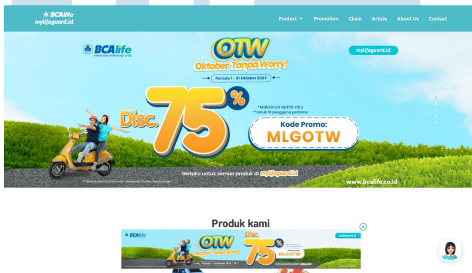
Gambar 2. 3 Tampilan Website Resmi Produk Digital BCA Life ( mylifeguard.id )

Berdasarkan sumber pada website resmi, BCA Life memiliki visi yaitu menjadi perusahaan asuransi jiwa terkemuka di Indonesia, yang dikenal akan keunggulan pelayanan dan loyalitas nasabahnya. Untuk mencapai visi tersebut berikut merupakan misi ataupun langkah-langkah yang harus dilakukan seperti: