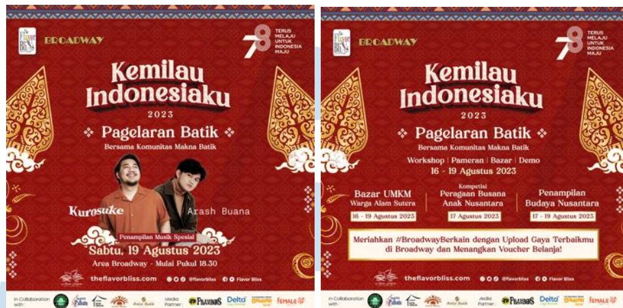
Gambar 2. 4 Kemilau Indonesiaku