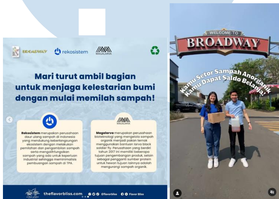
Gambar 2. 6 Rekosistem dan Magalarva

Pada bulan Oktober 2022, The Flavor Bliss Alam Sutera bersama dengan Rekosistem dan Magalarva menjalankan kerjasama atau partnership untuk melakukan pengolahan sampah dari hasil aktifitas seluruh tenant Broadway dan The Flavor Bliss . Untuk sampah anorganik diolah bersama rekosistem, sedangkan sampah organik diolah bersama Magalarva. The Flavor Bliss juga terus mengajak pengunjung untuk sadar akan pentingnya pengolahan sampah yang benar melalui akun instagramnya. Para pengunjung yang ingin berkontribusi untuk mulai memilah sampah juga dapat menyetorkannya ke Waste Station Rekosistem yang berlokasi di Pelant Nursery, Open Door Area - The Flavor Bliss Alam Sutera. Kerjasama tersebut masih berjalan hingga saat ini.