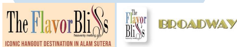
Gambar 2. 2 Logo The Flavor Bliss dan Broadway

Bidang usaha yang dimiliki Alam Sutera Group terdiri dari Township yang meliputi Alam Sutera, Suvarna Sutera, dan Ayodhya by Alam Sutera. Office Tower yang meliputi Wisma Argo Manunggal, The Prominence , Synergy Building , dan The Tower . Commercial dan Retail yang meliputi The Flavor Bliss dan Mall @ Alam Sutera . Lalu Cultural Park yang meliputi Garuda Wisnu Kencana.