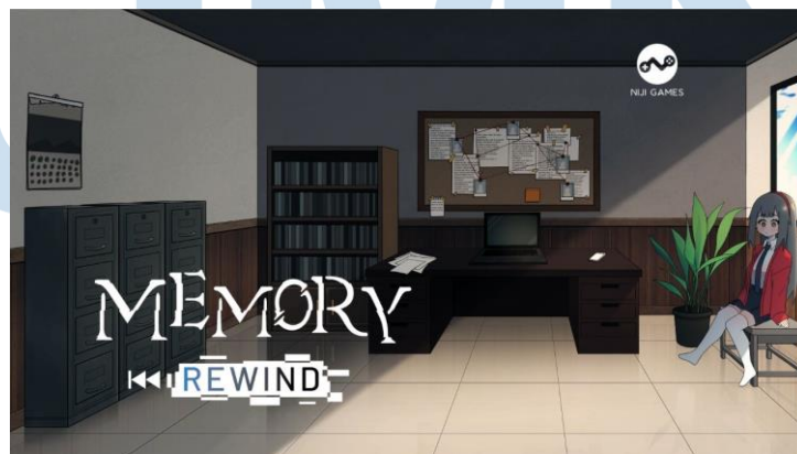
Gambar 2.4 Memory Rewind kerja sama Lion Core & Niji Games

Burst Fighter adalah game pertama yang dibuat oleh Lion Core. Burst Fighter pertama kali rilis pada tanggal 16 september 2017 di Steam. Burst fighter sendiri merupakan sebuah permainan tembak-tembakan arcade yang unik, yang dapat memberikan pemain pengalaman tembak-tembakan klasik, dengan banyak pesawat atau space jet yang dapat disesuaikan sesuai dengan kemauan pemain. Terdapat 8 level yang dirancang untuk pemain hadapi, dengan pertempuran dengan bos yang unik serta kisah atau story yang dapat di nikmati pemain tentang balas dendam dan pemberontakan dalam permainan.