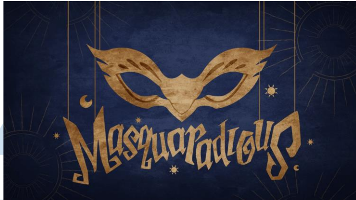
Gambar 2.6 Masquaradious dari Lion Core

Masquaradious adalah permainan yang pada saat ini masih dalam tahap pengembangan secara aktif oleh tim Lion Core. Masquaradious merupakan permainan aksi tembak-tembakan bergaya roguelike yang mengambil inspirasi dari tema buku cerita anak untuk menciptakan gaya visual yang unik. Permainan ini menggunakan penggabungan elemen-elemen khas roguelike yang mencakup lantai-lantai yang dibangun secara acak dan kematian permanen dengan penekanan yang kuat pada narasi cerita. Masquaradious direncanakan akan rilis di Steam dan Console.