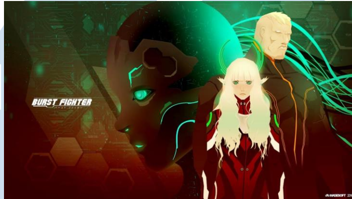
Gambar 2.3 Burst Fighter dari Lion Core

Berikut merupakan hasil karya dan juga kerja sama yang telah dilakukan oleh Lion Core Studio mulai dari tahun 2016 sampai dengan saat ini: