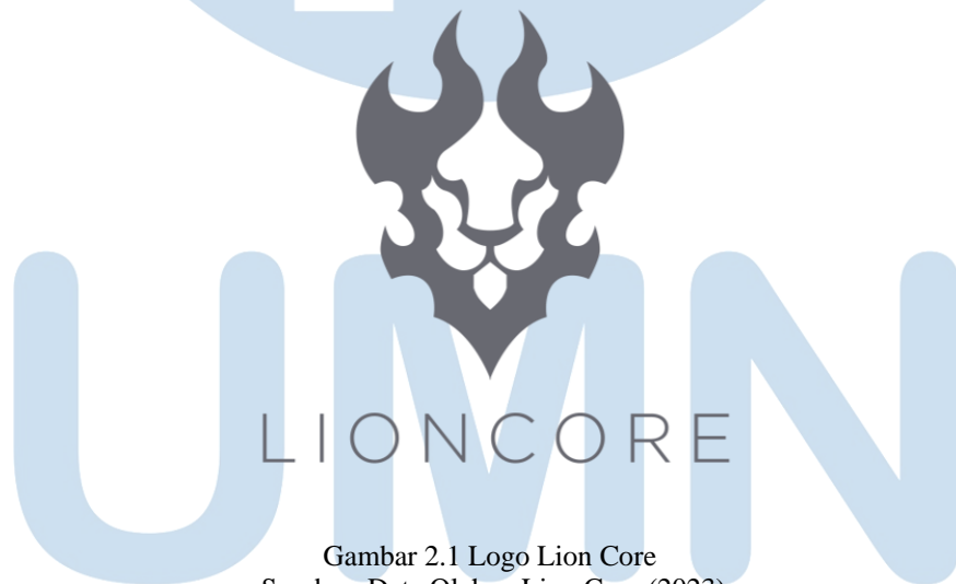
Gambar 2.1 Logo Lion Core

Lion Core Studio merupakan sebuah Studio yang bergerak di industri pembuatan permainan ( game ) berbasis digital dengan menggunakan platform seperti komputer, laptop sebagai wadahnya. Lion Core Studio didirikan pada tahun 2016 di Malang dengan menggunakan nama awal “ Gamesoft ” dan meluncurkan game pertamanya pada tahun 2017 yang berjudul “ Burst Fighter .” Namun, pada tahun 2022, setelah penyambutan kepada anggota baru serta visi dan misi yang baru, Gamesoft melakukan rebranding menjadi Lion Core, dengan maksud memfokuskan tujuan utamanya dalam menciptakan video game bergaya yg unik dengan menggunakan gaya anime sebagai preferensinya.