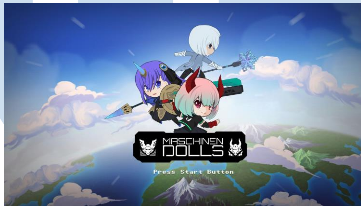
Gambar 2.5 Machinen Dolls dari Lion Core

Memory Rewind adalah game kerja sama pertama yang dilakukan oleh Lion Core bersama dengan Niji Games, dimana game ini masih dalam tahap pengembangan. Memory Rewind merupakan sebuah permainan visual novel yang unik tentang seorang detektif yang memiliki kemampuan untuk dapat melakukan perjalanan waktu ke masa lalu, dimana detektif tersebut harus dapat memecahkan masalah dari klien-kliennya tersebut dengan menggunakan kekuatannya melalui gameplay deduksi yang unik. Game ini direncanakan akan rilis di Steam dan Console.