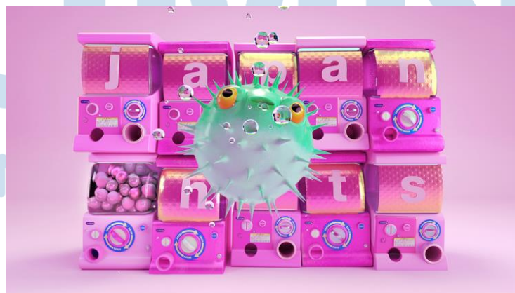
Gambar 2.4 MTV Music Bumpers

Kemudian, SuperPixel juga pernah bekerja sama dengan MTV untuk memproduksi video music bumpers pada tahun 2018. Pada proyek MTV ini, SuperPixel mengeksekusinya menggunakan teknik 3D modelling dan 3D animation . Video music bumpers tersebut ditayangkan di Asia dan Eropa.