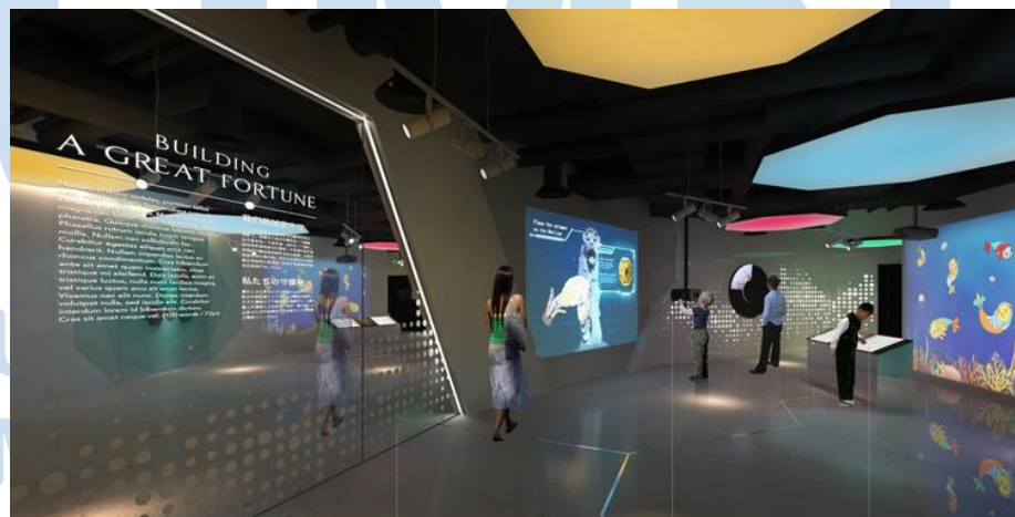
Gambar 2.6 Sentosa Merlion Content Revamp

SuperPixel pernah berkolaborasi dengan Multimedia People and Kingsmen, dan bertanggung jawab atas animasi dan konten interaktif untuk perubahan-perubahan baru di dalam ruang Sentosa Merlion. Proyek yang dikerjakan oleh SuperPixel adalah dari film pendek Sang Nila Utama di dalam teater, hingga beberapa video interaktif pada bagian galeri.