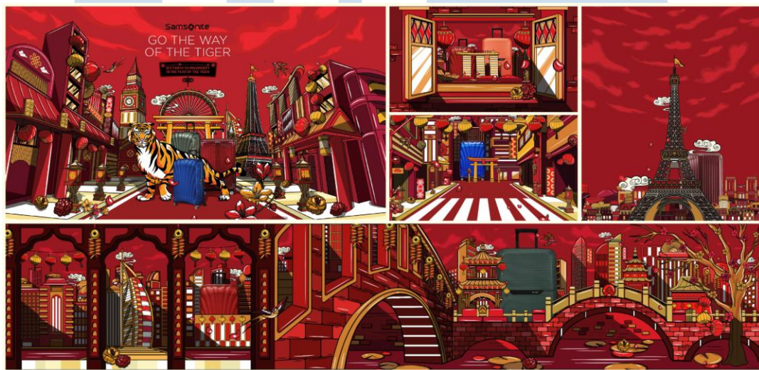
Gambar 2.7 Samsonite Asia Chinese New Year Campaign

Kemudian pada tahun 2022, SuperPixel bekerjasama dengan Samsonite Asia untuk tetap mempertahankan posisinya sebagai sebuah brand yang berada di top of mind para penjelajah dunia dengan cara menjadi bagian dari perayaan internasional utama, yaitu Chinese New Year atau Tahun Baru Imlek. SuperPixel mengungkap makna “GO THE WAY OF TIGER” dengan menggunakan gaya visual pop art yang berani dan modern. Pada proyek ini, SuperPixel menggunakan teknik visualisasi 2D animation .