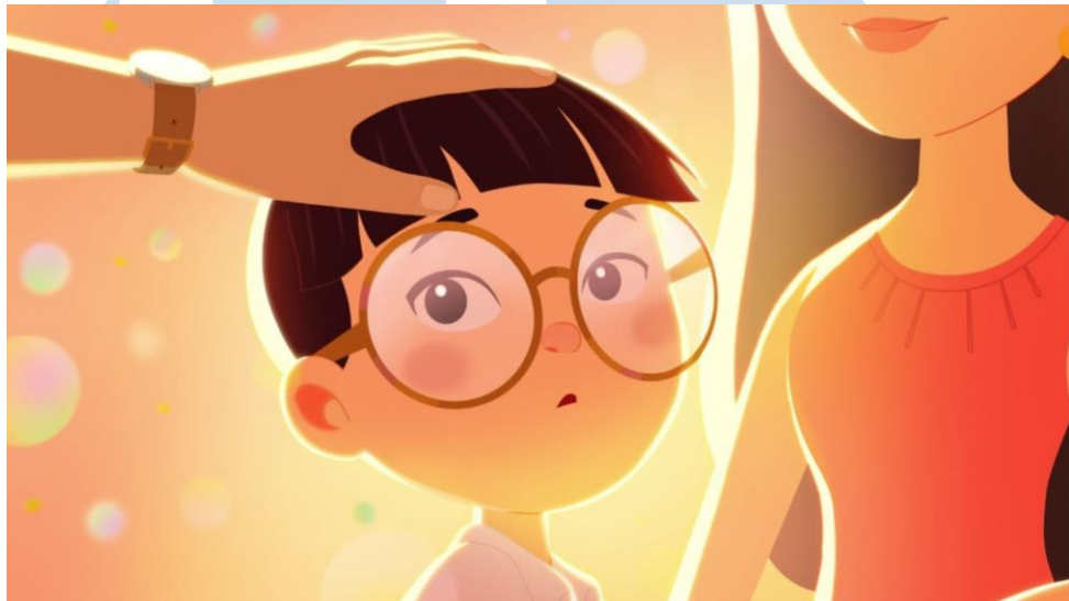
Gambar 2.3 McDonald's Family Mental Wellness Ad

bagian dari peluncuran kampanye. Film ini bertujuan untuk meningkatkan kesadaran tentang peran penting orang tua selama masa kanak-kanak ketika anak-anak mulai merasa stress , dan akan dipromosikan di saluran media sosial McDonald's Singapura.