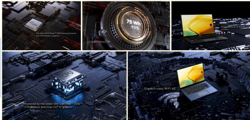
Gambar 2.5 ASUS Zenbook 14 Product Feature Series

Selain itu, SuperPixel juga pernah bekerjasama dengan ASUS untuk memproduksi video explainer dengan tujuan menjelaskan fitur-fitur yang terdapat dalam produk ASUS yang berupa laptop. Teknik yang digunakan pada visualisasi proyek ini adalah 3D modelling dan 3D animation .