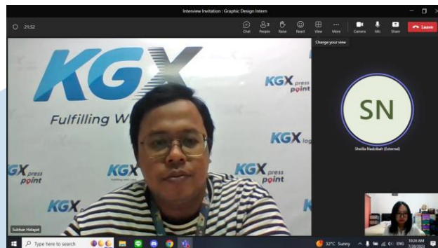
Gambar 1.3 Proses Interview di KGX

Selain KGX, penulis juga mendapatkan panggilan interview dari Kompas Gramedia Group of Manufacture yang dilakukan secara offline di Gedung Kompas Gramedia Palmerah Selatan pada 21 Juli 2023. Setelah mengikuti sesi interview dengan kedua perusahaan tersebut, penulis diberikan kebebasan untuk memilih perusahaan yang ingin dijadikan sebagai tempat kerja magang. Setelah mempertimbangkan beberapa faktor, seperti sistem kerja, jarak tempuh ke kantor, dan deskripsi pekerjaan, penulis memutuskan untuk memilih KGX sebagai tempat kerja magang.