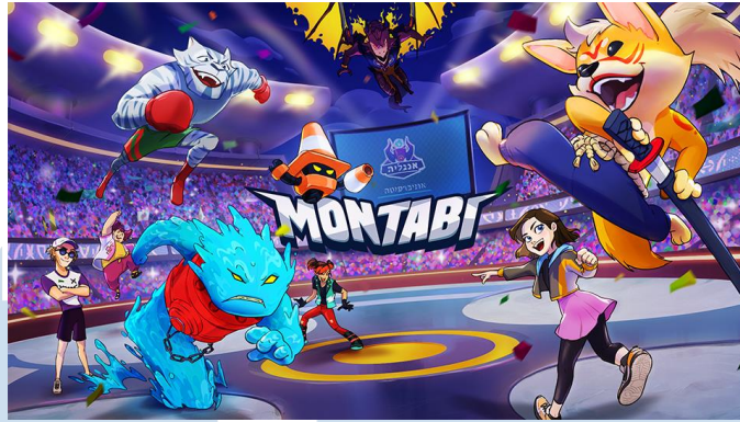
Gambar 2.2 Key Art Montabi