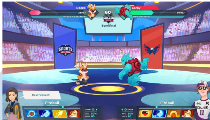
Gambar 2.4 Tampilan Montabi

Selain mengembangkan IP, Mankibo juga menyediakan jasa pengembangan game dalam berbagai media dan platform, seperti game mobile , desktop , web browser , AR , dan VR . Layanan yang disediakan adalah pengembangan game secara penuh maupun parsial untuk art dan programming . Beberapa klien yang telah bekerja sama dengan Mankibo adalah WIR Group, Nusameta, Pikorua Studio, dan Avarik Saga.