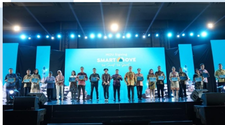
Gambar 2.6 Jajaran Direksi Sinar Mas Land dalam Peluncuran Program Smart Move

Selain mengikuti event-event besar yang ada, Sinar Mas Land juga aktif membuat event tersendiri, khususnya ketika peluncuran perumahan, produk atau promo baru. Salah satu event besar yang diadakan tahun 2023 ini adalah peluncuran program Smart Move, yang mulai diadakan sejak bulan Januari 2023 hingga Desember 2023 nanti. Event ini merupakan salah satu event terbesar yang diadakan Sinar Mas Land, dikarenakan secara langsung diadakan dan ditayangkan di 5 kota besar Sinar Mas Land, yaitu Jakarta, Bekasi, Surabaya, Batam, dan Balikpapan