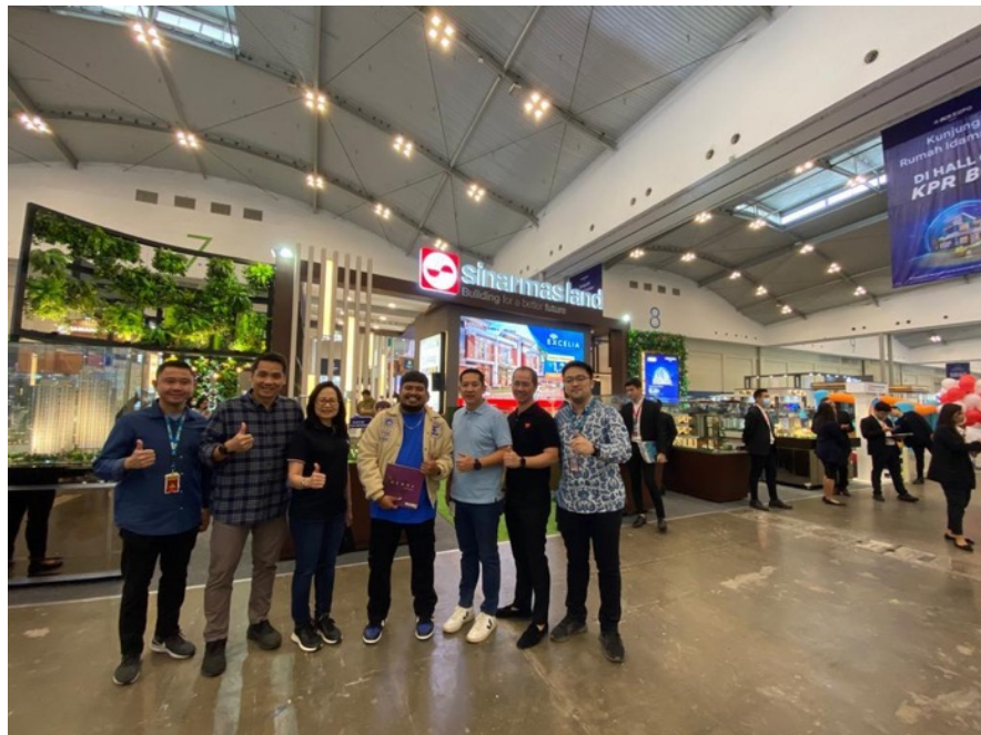
Gambar 2.5 Booth Sinar Mas Land di BCA Expo 2023

Salah satu event terbesar yang rutin diikuti oleh Sinar Mas Land adalah BCA Expo. BCA Expo merupakan salah satu event rutin yang diadakan oleh Bank BCA sebagai salah satu bentuk apresiasi pada nasabah dan mitra kerja BCA atas segala dukungan yang telah diberikan selama ini hingga dapat menjadi bank nomor 1 yang dipercaya oleh masyarakat. Dengan undangan yang diberi kepada nasabah prioritas dan solitaire, Sinar Mas Land mengambil kesempatan untuk ikut andil dalam event BCA Expo agar mendapatkan leads yang baik dan memuaskan.