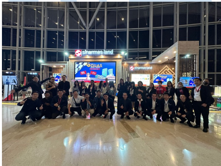
Gambar 2.3 Booth Sinar Mas Land di GIIAS 2023

Gaikindo International Auto Show (GIIAS) merupakan acara pameran otomotif terbesar tahunan yang diadakan di Indonesia, khususnya ICE, BSD City. GIIAS merupakan acara yang secara tahunan diadakan di Indonesia sejak tahun 1986. Mulai dari tahun 2015, GIIAS secara berkala dilaksanakan di ICE, BSD City. Hal ini lah yang membuat Sinar Mas Land secara aktif mengikuti event GIIAS untuk mempromosikan berbagai produk perumahan yang dijual. Hal ini juga didukung dengan target konsumen dari GIIAS yang berada dikalangan menengah ke atas.