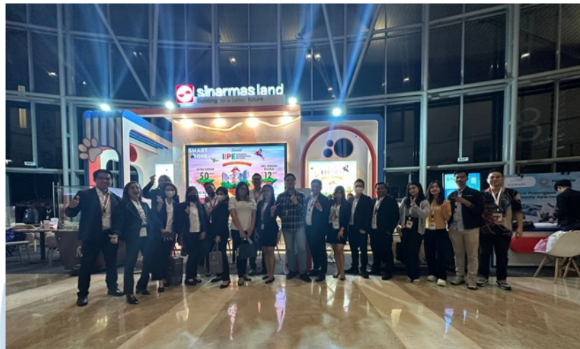
Gambar 2.4 Booth Sinar Mas Land di IPE 2023

Salah satu event terbesar yang rutin diikuti oleh Sinar Mas Land adalah BCA Expo. BCA Expo merupakan salah satu event rutin yang diadakan oleh Bank BCA sebagai salah satu bentuk apresiasi pada nasabah dan mitra kerja BCA atas segala dukungan yang telah diberikan selama ini hingga dapat menjadi bank nomor 1 yang dipercaya oleh masyarakat. Dengan undangan yang diberi kepada nasabah prioritas dan solitaire, Sinar Mas Land mengambil kesempatan untuk ikut andil dalam event BCA Expo agar mendapatkan leads yang baik dan memuaskan.