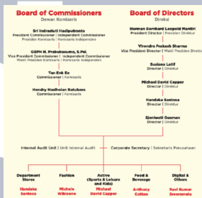
Gambar 2.2 Bagan Struktur Organisasi Perusahaan

Struktur perusahaan adalah kerangka organisasi yang mengatur bagaimana suatu perusahaan diorganisasikan, dikelola, dan beroperasi. Struktur ini mencakup pembagian tanggung jawab, hierarki, dan hubungan antar bagian atau divisi dalam perusahaan. Berikut adalah struktur organisasi dari PT. Mitra Adiperkasa: