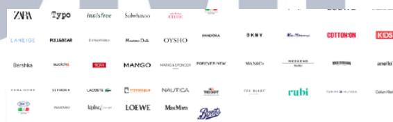
Gambar 2.6 Brand Fashion PT. Mitra Adiperkasa (MAP)

Di dalam Departemen Fashion , tidak hanya menawarkan produk-produk mode, tetapi juga mencakup produk-produk perawatan kulit dan