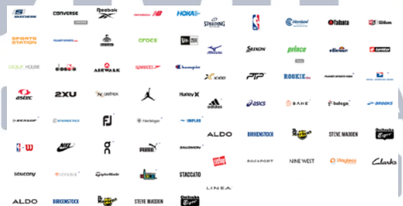
Gambar 2.4 Brand Sports PT. Mitra Adiperkasa (MAP)