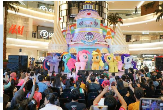
Gambar 2.5 My Little Pony Christmas Event di Emporium Pluit Mall

koleksi mainan Science Discovery #Mindblown yang dapat mengasah kemampuan berpikir anak mulai dari set mainan eksperimen membangun robot, menggali fosil, blok bangunan magnetik, dan mainan informatif lainnya yang dapat ditemukan di gerai Kidz Station.