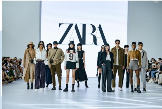
Gambar 2.6 Jakarta Fashion Week 2023