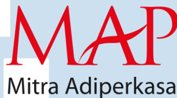
Gambar 2.1 Logo Mitra Adiperkasa

Mitra Adiperkasa telah berdiri sejak tahun 1995. Dari sejak berdirinya, MAP telah mengalami pertumbuhan yang pesat. Awalnya MAP hanya berbisnis produk olahraga. Lalu pada tahun 1997, MAP berekspansi ke bisnis mainan anak-anak. Pada tahun 2002, MAP berekspansi ke bisnis makanan dan minuman. Setahun setelahnya berekspansi ke bisnis department store . Pada tahun 2016, MAP meluncurkan MAP EMALL, MAP Club, dan MAP Retail School.