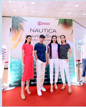
Gambar 2.3 Trunk Show Nautica di SOGO Plaza Senayan

bertema ‘Resort Collection’, diharapkan SOGO bisa menjadi lebih dekat dengan para pencinta fesyen di Jakarta.