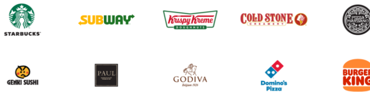
Gambar 2.8 Merek-merek PT.MAP Boga Adiperkasa

Di mulai dari dibukanya gerai Starbucks pertama di Indonesia pada tahun 2002. Gerai pertama tersebut diikuti dengan pembukaan gerai-gerai Starbucks lainnya di Indonesia. Setelah itu, MAP membuka gerai pertama Krispy Kreme dan Pizza Express pada tahun 2006 dan dilanjutkan dengan pembukaan gerai pertama Cold Stone pada tahun 2007. MAP mengakuisisi Genki Sushi pada tahun 2018 dan mengakuisisi Paul Bakery pada tahun 2019. Hingga yang paling baru adalah MAP bermitra dengan Subway untuk menghadirkan gerai Subway pertama di Indonesia pada tahun 2021. Kini, MAP telah memiliki 800 gerai yang tersebar di 44 kota di Indonesia.