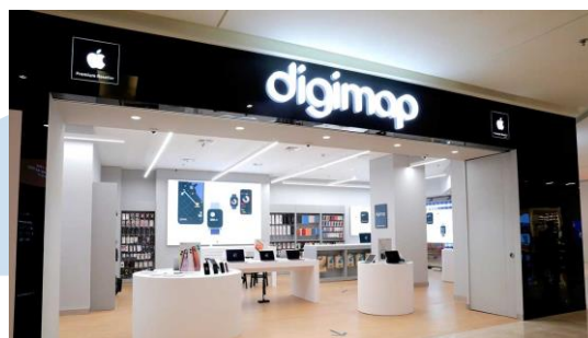
Gambar 2.7 Gerai Digimap Grand Indonesia

Sumber: https://canggih.id/digimap-resmikan-apple-premium-reseller-berstandar-global-pertama-di-indonesia/ (2020)