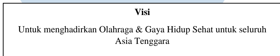
Gambar 2. 2 Gambar visi MAP Active Sumber: Situs Web MAP Active

Sebagai perusahaan yang berkomitmen untuk memajukan gaya hidup sehat dan aktif di kalangan masyarakat Indonesia, visi dari PT. MAP Aktif Adiperkasa adalah " To bring Sports & Healthy Living to all Indonesians ".