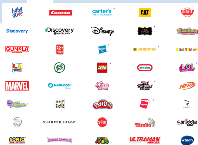
Gambar 2. 7 Brand Kids

Merek produk anak-anak yang dikelola oleh PT MAP Aktif Adiperkasa, Tbk telah menjadi elemen integral dalam memenuhi kebutuhan anak-anak dengan kreativitas dan kualitas yang tinggi. Berikut dibawah ini terdapat beberapa merek produk untuk anak-anak yang telah dihadirkan oleh PT. MAP Aktif Adiperkasa, Tbk di Indonesia.