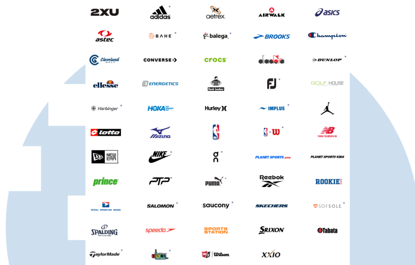
Gambar 2. 5 Brand Sports

Pada sektor merek sports , PT MAP Aktif Adiperkasa, Tbk telah berhasil membawa beragam merek ternama seperti Sketchers, Converse, Reebok, New Balance, Adidas, Sports Station, Planet Sports. Asia, Foot Locker, Crocs, New Era Cap Co., Golf House, Diadora, dan banyak lagi. Portofolio ini mencakup berbagai peralatan yang dibutuhkan untuk berbagai jenis olahraga.