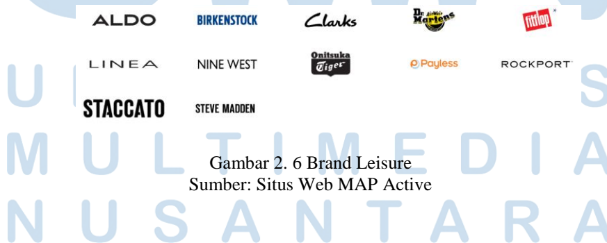
Gambar 2. 6 Brand Leisure

Merek leisure yang dikelola oleh PT MAP Aktif Adiperkasa, Tbk telah menjadi elemen utama dalam menciptakan pengalaman santai dan hiburan bagi konsumen. Di bawah ini terdapat beberapa merek leisure yang telah dihadirkan oleh PT. MAP Aktif Adiperkasa, Tbk.