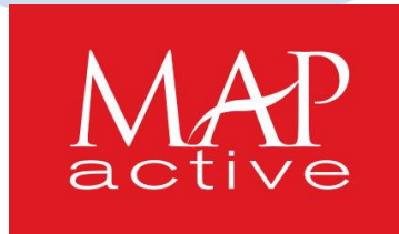
Gambar 2. 1 Logo MAP Active

PT MAP Aktif Adiperkasa, Tbk atau disingkat dengan MAA didirikan pada tahun 1995. PT. MAP Aktif Adiperkasa, Tbk merupakan salah satu anak perusahaan penting dari Mitra Adiperkasa yang memiliki fokus utama pada sektor ritel produk olahraga. Perusahaan ini memiliki Kantor pusat yang berlokasi di gedung Sahid Sudirman di Jakarta Pusat dan telah sukses dalam bisnisnya yang dikenal sebagai MAP Active.