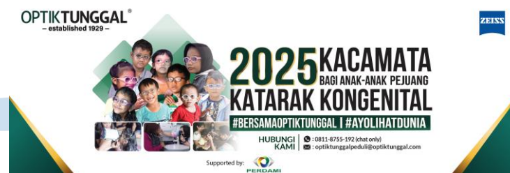
Gambar 2.5 Web banner program 2025 kacamata

Merupakan salah satu donasi terbesar Optik Tunggal yang didukung oleh PERDAMI (Perhimpunan Dokter Spesialis Mata Indonesia) untuk membantu keluarga pra-sejahtera yang memiliki anak dengan diagnosis katarak kongenital. Sebanyak 2025 kacamata diberikan secara gratis kepada anak-anak penderita katarak berusia hingga 10 tahun. Kacamata tersebut menggunakan lensa khusus dari ZEISS yang merupakan Perusahaan lensa ternama asal Jerman. Event ini dibuat oleh Optik Tunggal sebagai kegiatan sosial yang membantu keluarga kurang mampu di Indonesia yang anaknya memiliki katarak sejak dini.