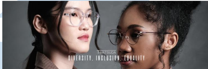
Gambar 2.3 Advertising T Matsuda

mengikuti runway show UIFW pada tanggal 28 Januari 2023 di Senayan Park.