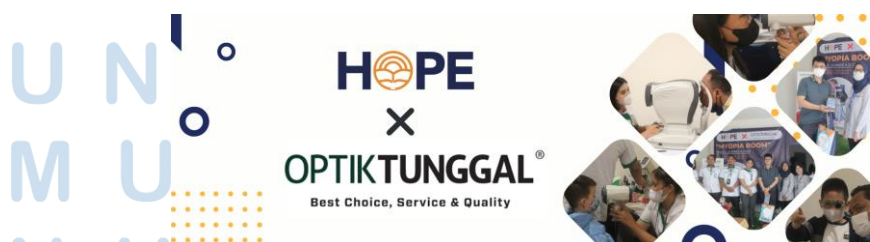
Gambar 2.4 Web banner kolaborasi HOPE X Optik Tunggal

Merupakan salah satu event kolaborasi antara Hope school Indonesia dengan Optik Tunggal. Event ini terdiri dari seminar dengan tema ‘Myopia Boom’ yang dibawakan langsung oleh vision expert Optik Tunggal. Selain itu ada pemeriksaan mata gratis oleh Optik Tunggal untuk seluruh siswa dan staff Hope school Indonesia. Event Free eye checkup yang dilakukan oleh Optik Tunggal telah lama dijalankan sebagai salah satu cara Optik Tunggal untuk memperkenalkan perusahaannya.