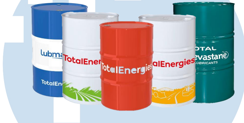
Gambar 2.2 Produk TotalEnergies

Series dan masih banyak lagi. Total produk yang disediakan oleh PT. Nabel Sakha Gemilang ada 25 produk dan memiliki spesifikasi yang berbeda sesuai dengan kebutuhan masing-masing customer .