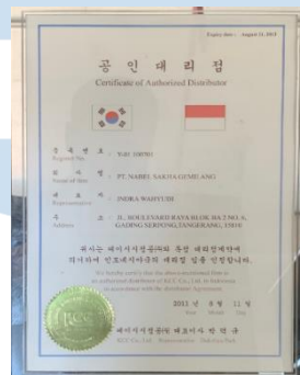
Gambar 2.6 Sertifikat Authorized Distributor KCC Pneumatic

Sebelum mendirikan 4 anak perusahaan lainnya, Nabel Sakha pada tahun 2007 telah menjual alat pneumatic KCC dari Korea. Seiring berjalannya waktu, akhirnya pada tahun 2011 Nabel Sakha Gemilang resmi ditunjuk sebagai distributor resmi KCC Pneumatic dan bertahan hingga sekarang dibawah naungan PT. Rafitama Millenial Wahyudi. Pemecahan ini terjadi agar Nabel Sakha Gemilang tetap memiliki fokus pada 1 produk saja, yaitu pelumas industri.