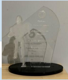
Gambar 2.9 Plakat TotalEnergies Target Achiever Industrial Sector

TotalEnergies Indonesia memberikan penghargaan penghargaan lainnya di tahun 2011. Penghargaan ini diberikan kepada Nabel Sakha sebagai pengakuan atas pencapaian luar biasa Nabel Sakha sebagai distributor yang bisa mencapai target penjualan, yang tidak hanya diselesaikan tepat waktu, tetapi juga mencapai angka tertinggi di industri sekelasnya. Kesuksesan Nabel Sakha dalam meraih penghargaan ini menunjukkan bahwa bukan hanya menjadi distributor penjualan yang baik, tetapi juga menjadi contoh bagi industri lainnya.