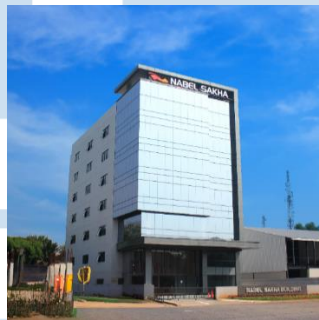
Gambar 2.3 Gedung Nabel Sakha Building

reflects outstanding performance and adequately reward those who invest ideas and positive contribution to the company." Dengan misi ini, Nabel Sakha memiliki tekad untuk terus berinovasi dalam penyediaan solusi pelumas industri dan terus memberikan pengembalian yang tinggi kepada perusahaan, serta penghargaan yang pantas kepada kontributor positif, yang memiliki tujuan untuk mencapai kesuksesan dan kepuasan customer yang jauh lebih besar.