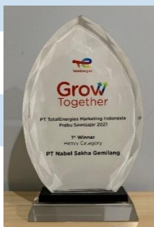
Gambar 2.10 Penghargaan Grow Together with TotalEnergies

PT. TotalEnergies Marketing Indonesia sering mengadakan beberapa event untuk para distributornya, untuk menunjukkan komitmennya dalam membangun hubungan yang kuat dengan mitra bisnisnya. “ Grow Together with TotalEnergies ” adalah salah satu acara yang diadakan oleh TotalEnergies Indonesia. Event ini tidak hanya untuk memberikan apresiasi, tetapi juga untuk menghormati para distributornya yang telah bekerja keras untuk bisa mencapai target penjualannya. PT. Nabel Sakha Gemilang mengukuhkan posisinya sebagai distributor terkemuka dengan meraih juara 1 di kelas Heavy Category pada tahun 2021.