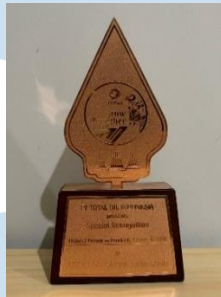
Gambar 2.8 Penghargaan dari TotalEnergies Marketing Indonesia

PT. TotalEnergies Marketing Indonesia tidak hanya berfokus pada penjualan produknya di Indonesia, tetapi juga aktif memberikan penghargaan kepada distributor resminya. TotalEnergies Indonesia memberikan penghargaan berupa sebuah plakat yang disebut “ Product Growth Together ” kepada distributornya yang telah mencapai target penjualan. Hal ini adalah salah satu cara TotalEnergies memberikan apresiasi kepada para distributornya yang telah mencapai target penjualan.