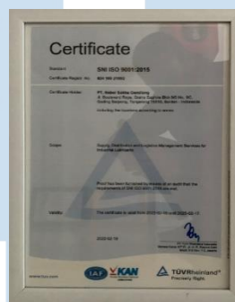
Gambar 2.7 Sertifikat SNI ISO 9001

Sertifikat ISO 9001 adalah salah satu standar internasional di bidang sistem manajemen mutu. Perusahaan jika sudah memenuhi untuk mendapatkan sertifikat ISO, maka dapat dikatakan perusahaan tersebut telah sesuai dengan persyaratan internasional dalam hal sistem manajemen mutu. Pada tahun 2015, PT. Nabel Sakha Gemilang telah menggunakan ISO 9001 ini untuk menjamin segala bentuk pembiayaan perusahaan dan transaksi agar bisa memenuhi syarat internasional.