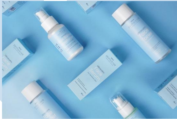
Gambar 2.6 Portfolio EGGHEAD Erha Skinsitive

terinspirasi oleh unsur air yang dominan berperan penting dalam hidrasi kulit. Logo tersebut hadir dalam tipografi yang bersih dan tipis dengan proporsi kata 'Skinsitive' yang lebih besar di bawah logo utama. Desain kemasannya hadir dengan sederhana namun lugas, menggunakan warna biru lembut sebagai warna utama. Menggambarkan esensi keunggulan perawatan kulit.