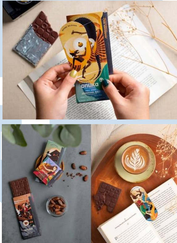
Gambar 2.3 Portfolio EGGHEAD Onuka Chocolate

menciptakan dampak yang berarti kebaikan dunia. Dalam pengembangan logo juga EGGHEAD bertujuan untuk mewakili komitmen Onuka terhadap bahan-bahan lokal berkualitas tinggi.