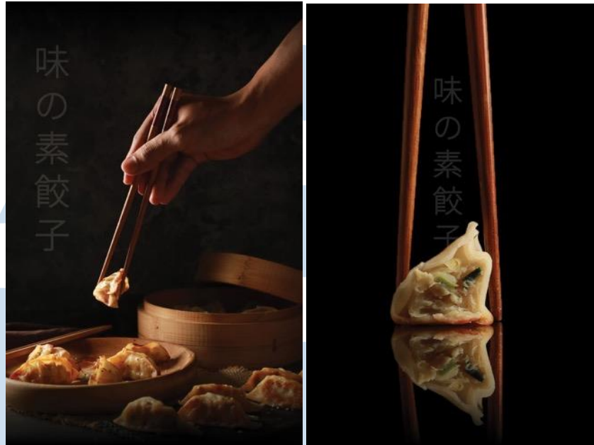
Gambar 2.5 EGGHEAD's Product Photography on Ajinomoto Gyoza