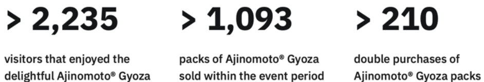
Gambar 2.4 EGGHEAD's Impact on Ajinomoto Gyoza

Strategi aktivasi kampanye di lapangan ini menawarkan Anda pengalaman yang tiada duanya memungkinkan para profesional dan eksekutif muda sebagai target pasar utama kami untuk merasakan dan menikmati hidangan Terinspirasi dari konsep Izakaya dari budaya makanan Jepang, kata “Izakaya” merupakan istilah Jepang yang terdiri dari tiga kanji yang berarti “tempat menginap-minum”. EGGHEAD menggabungkan konsep inti Izakaya otentik untuk merasakan Gyoza dari Ajinomoto itu sendiri.