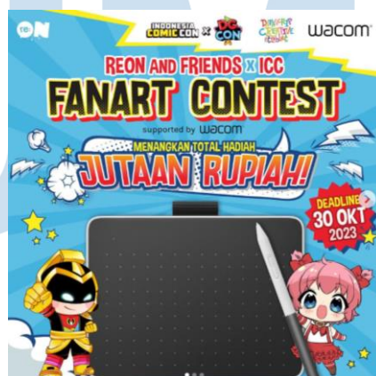
Gambar 2.6 Kolaborasi Re:ON Comics Dengan Wacom Dan Indo Comic Con

Kemudian, re:ON juga melakukan kolaborasi dengan Indo Comic Con dengan didukung oleh Wacom Indonesia dan Data Scrip Creative Tablet dengan mengadakan sebuah lomba fanart ilustrasi maskot re:ON dan berhadiah Wacom pen tablet beserta voucher belanja produk re:ON dan ICC.