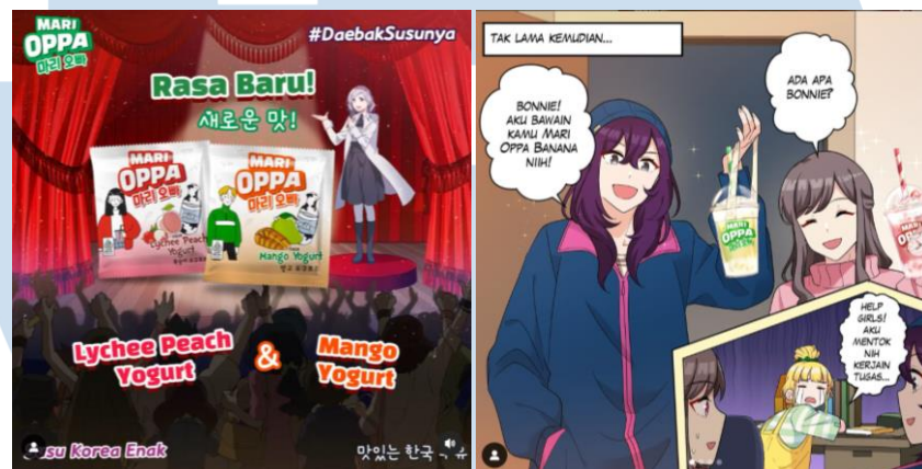
Gambar 2.5 Kolaborasi Re:ON Comics Dengan Marioppa

Re:ON Comics menjual buku mereka di toko online seperti ebooks Gramedia, shopee, dan Tokopedia juga toko offline seperti Gramedia. Selain, menjual produk buku percetakan, re:ON Comics juga seringkali melakukan kolaborasi dengan perusahaan lainnya, seperti kolaborasi re:ON dengan Marioppa yaitu salah satu minuman susu korea. Kolaborasi berupa seri komik dari re:ON yang membawakan cerita seputar minuman Marioppa.