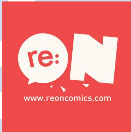
Gambar 2.1 Logo Re:ON Comics