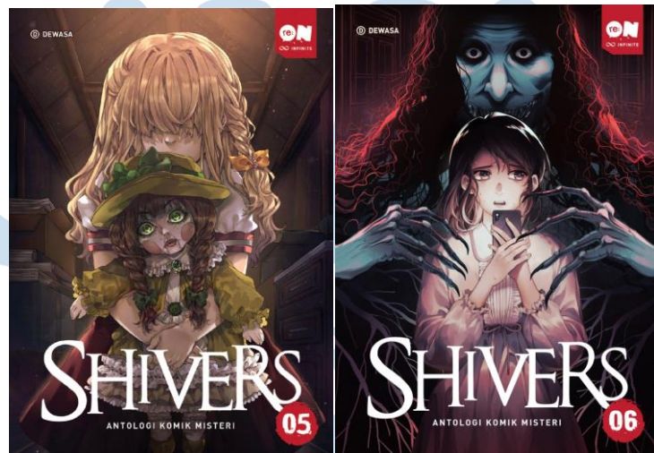
Gambar 2.4 Komik Shivers Volume 5 Dan 6

Selain komik-komik remaja romansa dan fantasi, re:ON Comics juga merilis komik dengan genre horror dan thriller yaitu “SHIVERS” dimana “SHIVERS” merupakan Kumpulan komik horor yang bersifat one-shot atau langsung tamat dalam satu cerita. “SHIVERS” juga menghadirkan berbagai cerita dari berbagai komikus Indonesia.