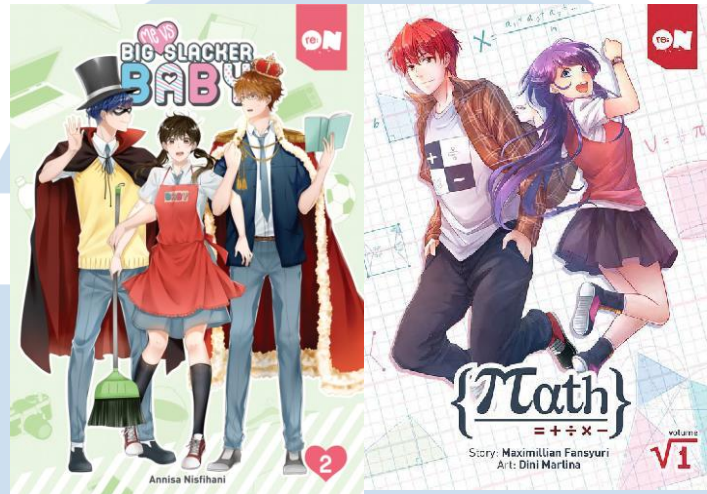
Gambar 2.3 Komik Re:ON “Me Vs Big Slacker Baby” Dan “Math”

Nusantara adalah re:ON Comics yang berupa majalah kompilasi komik dari berbagai komik Indonesia.