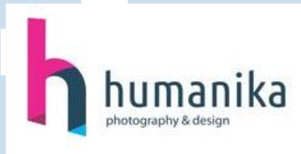
Gambar 2. 1 Logo Humanika Artspace

PT. Humanika Kreatif Desain didirikan pada tahun 2008, dengan visi untuk fokus pada industri kreatif, khususnya kemajuan desain, film dan fotografi di era digital. PT. Humanika Kreatif Desain kemudian memperluas pelayanannya di bidang fotografi dengan membuka jasa penyewaan kamera dan perlengkapan terkait, membuka sekolah khusus fotografi.