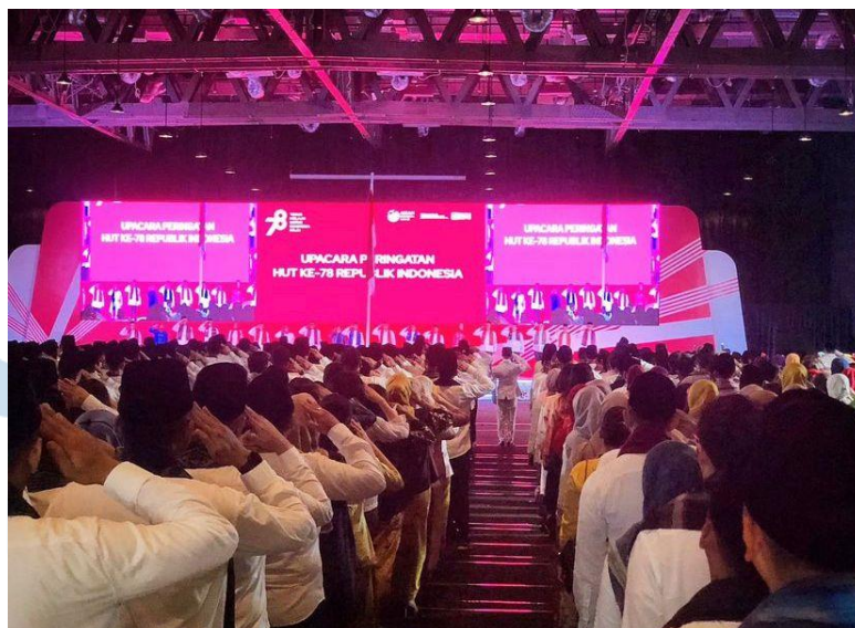
Gambar 2.4 BRILiaN Independence Week 2023