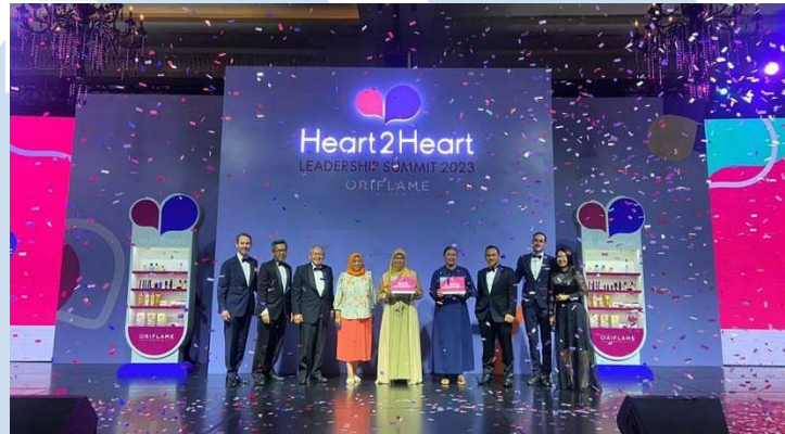
Gambar 2.3 Oriflame Leadership Summit 2023