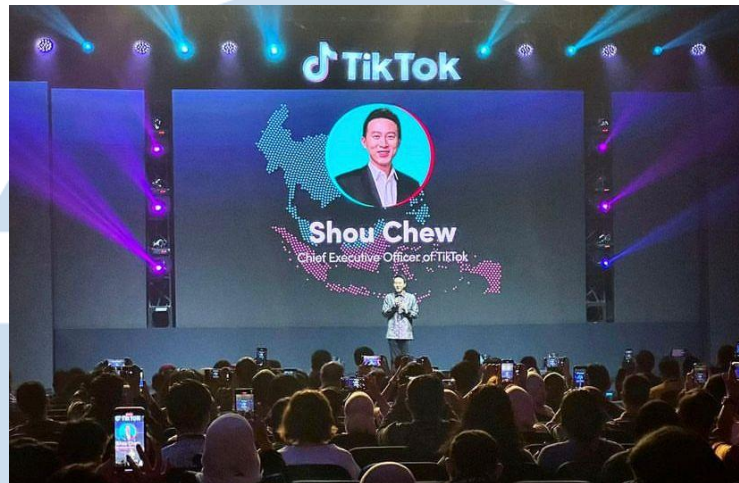
Gambar 2.5 SEAImpact Forum 2023