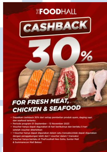
Gambar 2.7 POP Cashback 30%

Karya ini merupakan Point of Purchase (POP) untuk sebuah program promo cashback sebesar 30% yang diadakan oleh The Foodhall. Program ini memberikan kesempatan kepada pelanggan untuk mendapatkan cashback sebesar 30% dari setiap pembelian produk ayam, daging sapi, dan seafood tertentu di toko-toko The Foodhall.