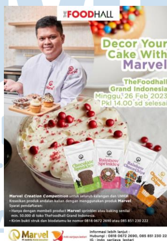
Gambar 2.6 POP Decor Your Cake With Marvel