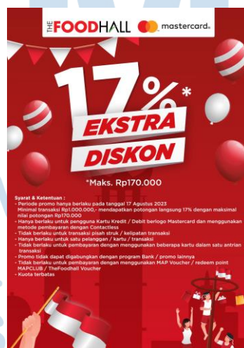
Gambar 2.8 POP Ekstra Diskon 17%