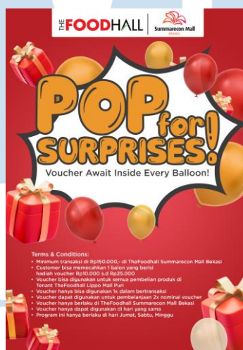
Gambar 2.4 POP Memecahkan Balon