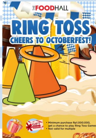
Gambar 2.5 POP Ring Toss

Karya ini adalah POP untuk permainan " Ring Toss " yang diciptakan dalam rangka memeriahkan perayaan Oktoberfest di The Foodhall. Permainan ini dirancang untuk memberikan pengalaman berbelanja yang lebih interaktif dan menyenangkan bagi para pelanggan yang berpartisipasi.