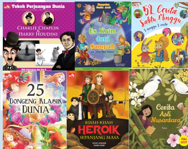
Gambar 2.5 Portofolio Perusahaan Buku Fiksi

Buku fiksi bergambar yang diterbitkan oleh Elex Media merupakan produk lokal dan terjemahan. Dimana Elex Media bekerja sama dengan penerbit asing ternama seperti, Disney Enterprises Inc. Nagaoka, Joei Tokyo, Harper Collins, dan Carlsen Verlag.