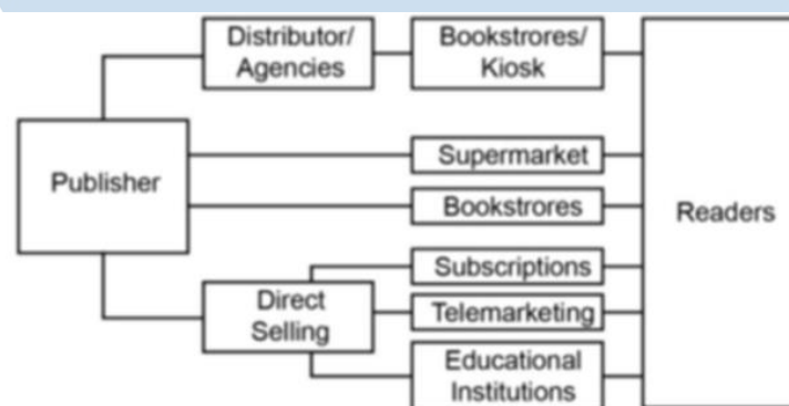
Gambar 2.2 Jaringan Distribusi

Dalam jaringan distribusi, PT. Elex Media Komputindo sendiri sudah tersebar di 8 wilayah Indonesia, diantaranya; Surabaya, Bandung, Semarang, Medan, Pekanbaru, Yogyakarta, Makasar, dan Palembang (Ibukota Jawa dan Sumatera). Pendistribusian oleh PT. Elex Media Komputindo sudah mencakup lebih dari 200 toko buku utama, 130 kios distribusi, toko retail, dan direct selling atau penjualan langsung.