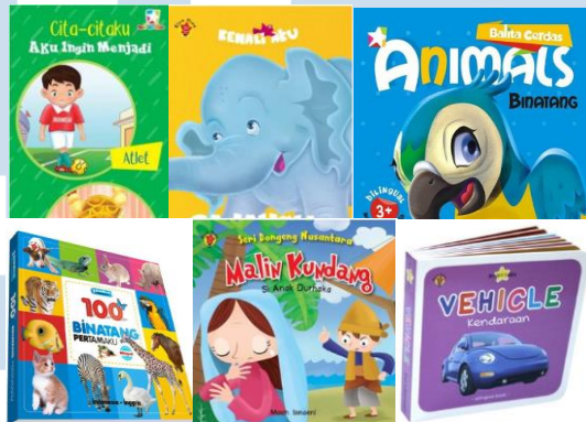
Gambar 2.8 Portofolio Perusahaan Board Book

Kelompok produk board book terutama ditujukan untuk anak-anak dibawah lima tahun. Berisi pengenalan konsep dasar yang dibutuhkan anak-anak pada tahap awal perkembangan pertumbuhan mereka.