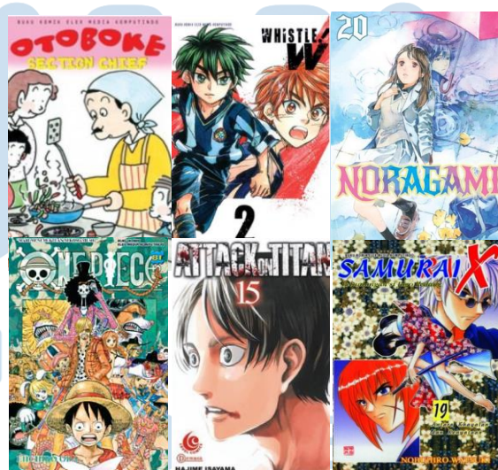
Gambar 2.9 Portofolio Perusahaan Komik

Komik terbagi menjadi dua macam pada Elex Media, yaitu komik lepas dan seri. Pertama kali komik terbitan Elex Media Komputindo, yaitu serial Candy Candy, Doraemon dan Kungfu Boy, dalam bentuk komik saku, dan kemudian semakin berkembang menjadi ribuan komik.