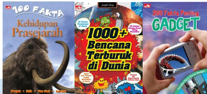
Gambar 2.6 Portofolio Perusahaan Sains & Referensi