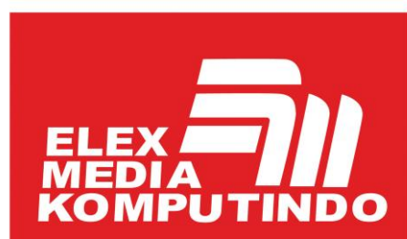
Gambar 2.1 Logo Perusahaan

PT. Elex Media Komputindo merupakan perusahaan penerbit buku dan majalah multimedia yang terbentuk pada 15 Januari 1985. Berlokasi di Gedung Gramedia Lt. 6, Jalan Palmerah Selatan 22-28, Jakarta 10270, kemudian berpindah di Gedung Kompas Gramedia Lt. 3, Jalan Palmerah Barat 29-37, Jakarta Pusat 10270. Sekarang perusahaan ini berada di lantai 2 dengan gedung yang sama. PT. Elex Media Komputindo seiring berkembangnya waktu, perusahaan ini menjangkau lebih luas jenis buku lainnya seperti buku anak, manajemen, agama dan spiritualitas, parenting, dan komik.