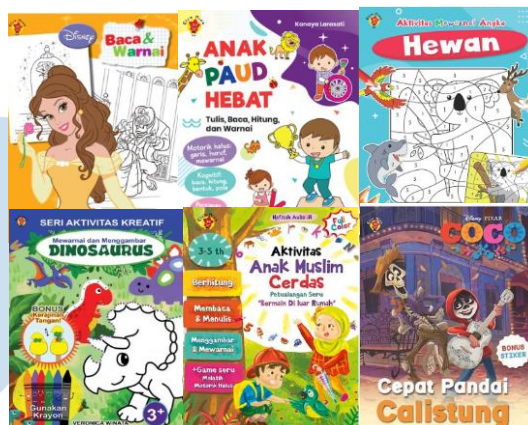
Gambar 2.7 Portofolio Perusahaan Kerja & Aktivitas

Kelompok produk buku kerja & aktivitas anak ditujukan untuk anak-anak di tingkat TK dan SD. produk kelompok ini dirancang untuk membantu orangtua menyediakan bahan dan sarana untuk belajar sambil bermain. Materinya sangat beragam, mulai dari ilmu pengetahuan praktis, moral, hingga materi yang menunjang pendidikan berdasarkan kurikulum di sekolah. Anak-anak bisa mengepresikan emosi, pengetahuan, dan pengalaman mereka melalui seri-seri ini.