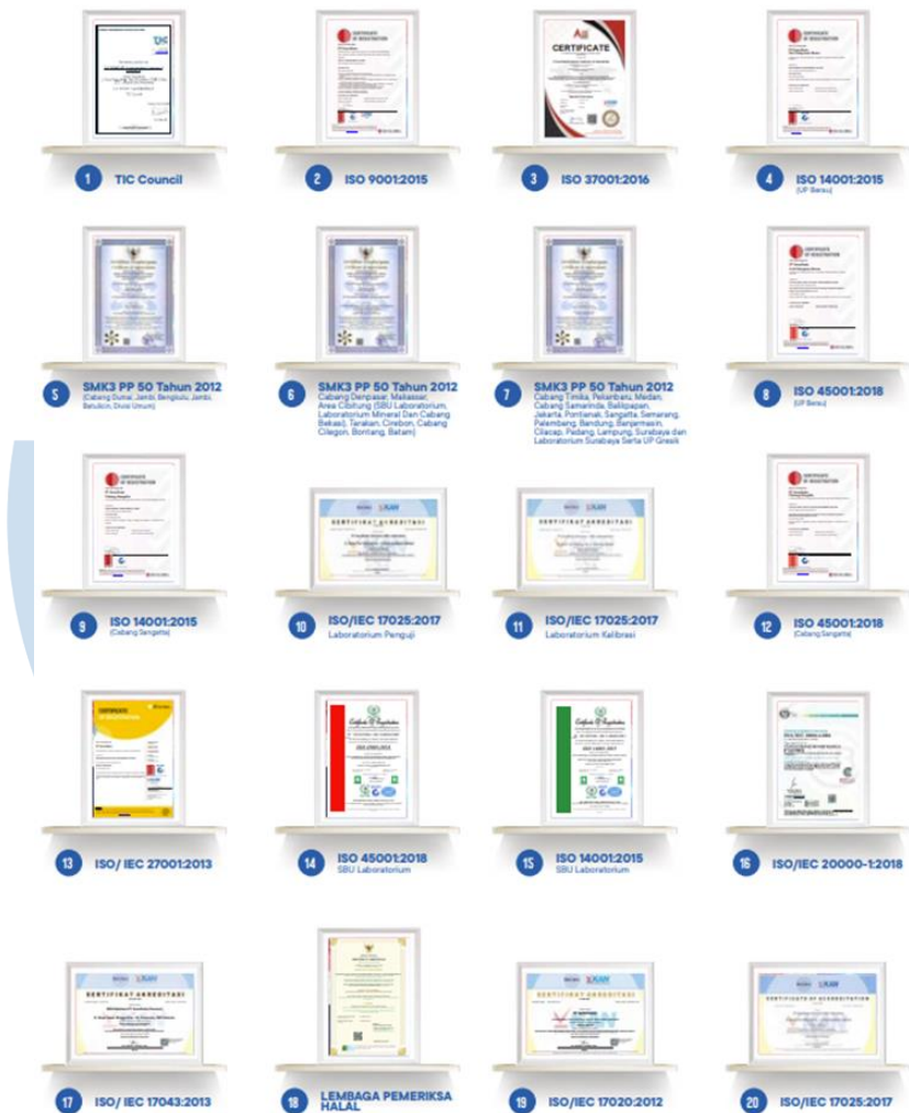
Gambar 2.2 Pencapaian Sertifikasi PT. Sucofindo

PT. Sucofindo memainkan peran penting dalam memverifikasi kuantitas dan kualitas berbagai produk, termasuk produk pertanian, kehutanan, perikanan, makanan, industri, pertambangan, minyak dan gas, serta barang konsumsi. Layanan ini tidak hanya melindungi kepentingan pemangku kepentingan, tetapi juga memastikan kepatuhan terhadap standar teknis untuk produk yang diperdagangkan. Dilengkapi dengan audit pemasok, pendekatan holistik Sucofindo memosisikan mereka sebagai mitra terpercaya bagi para pelaku usaha yang ingin mematuhi peraturan, jaminan kualitas, dan praktik-praktik yang berkelanjutan.