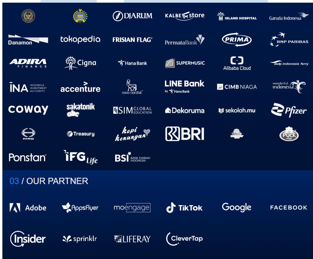
Gambar 2.3 Protfolio perusahaan

Dibawah ini, merupakan sejumlah klien yang telah menjalin kerjasama dengan Volare Group, Magnus, Clabstream dan Eyden. Magnus dan Clabstream yang melakukan tahapan eksekusi produksi mulai dari pra produksi hingga paska produksi berlangsung.