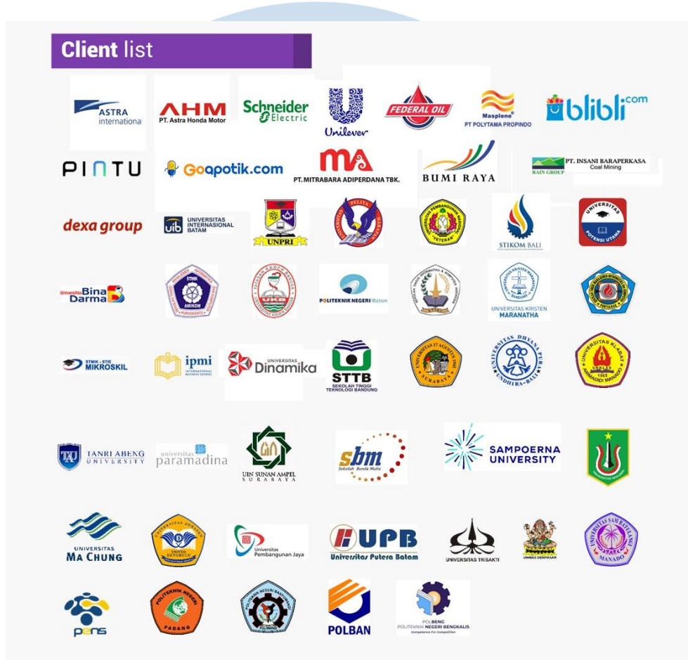
Gambar 2.4 Client List Perusahaan