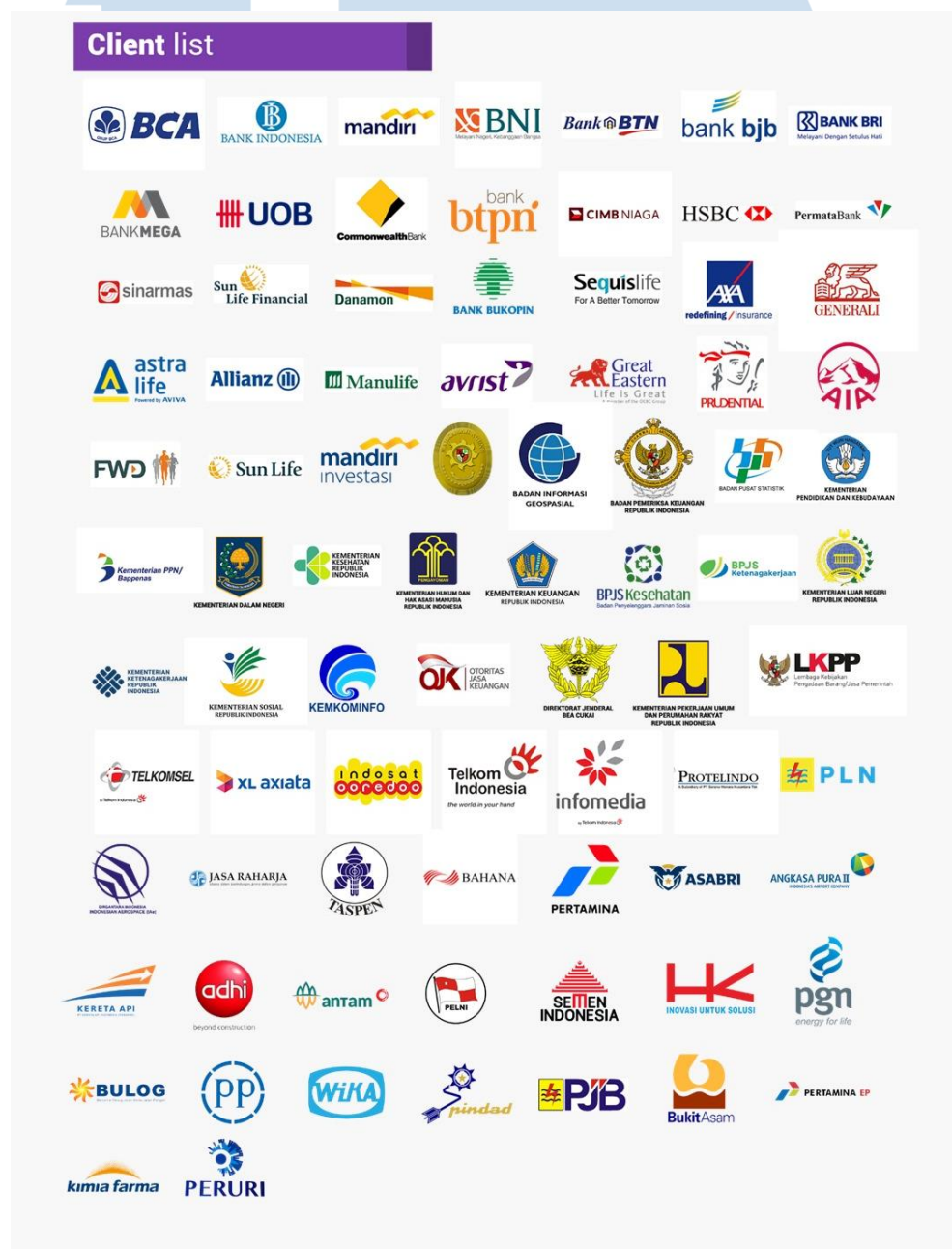
Gambar 2.3 Client List Perusahaan

Di bawah ini, merupakan sejumlah klien yang telah menjalin kerjasama dengan Multimatics selama perusahaan ini beroperasi: