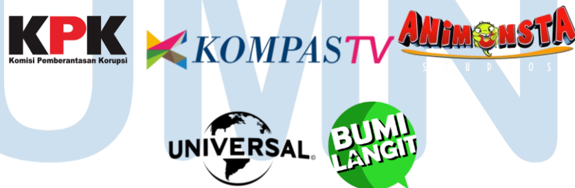
Gambar 2.3 Contoh Gambar Portofolio

UMN Picture adalah perusahaan yang bergerak di bidang animasi dan video production. telah mengerjakan proyek animasi dari studio animasi di tiga negara yaitu Malaysia, Indonesia, dan Amerika. Selain itu, UMN Picture juga pernah mengerjakan video production untuk perusahaan swasta seperti Kompas dan KPK. Dalam pengalaman tersebut UMN Picture telah memiliki pencapaian pengalaman dalam mengerjakan proyek animasi dan video production baik dari dalam maupun luar negeri serta telah bekerja sama dengan beberapa perusahaan ternama di Indonesia.