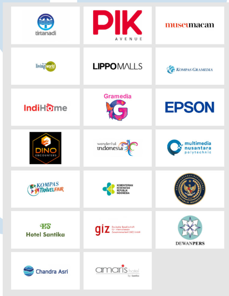
Gambar 2.5 Contoh Gambar partnership & Portofolio