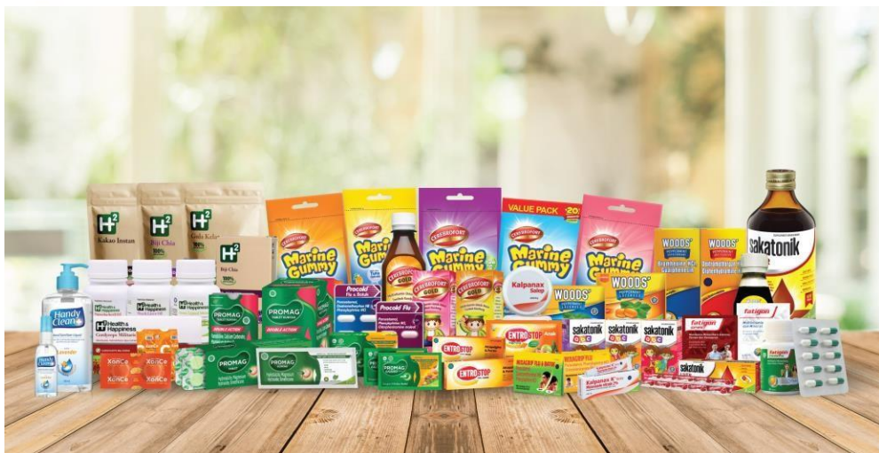
Gambar 2 2 Produk Kalbe Consumer Health