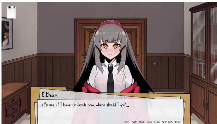
Gambar 2.6 Memory Rewind

Sebuah game dengan genre visual novel yang menceritakan tentang seorang investigator yang memiliki kemampuan untuk mengulang waktu untuk menyelesaikan kasus-kasus supernatural. Game tersebut merupakan produk kemitraan antara Lion Core Studio dengan Nidji Games dan direncanakan untuk rilis di konsol game dan PC.