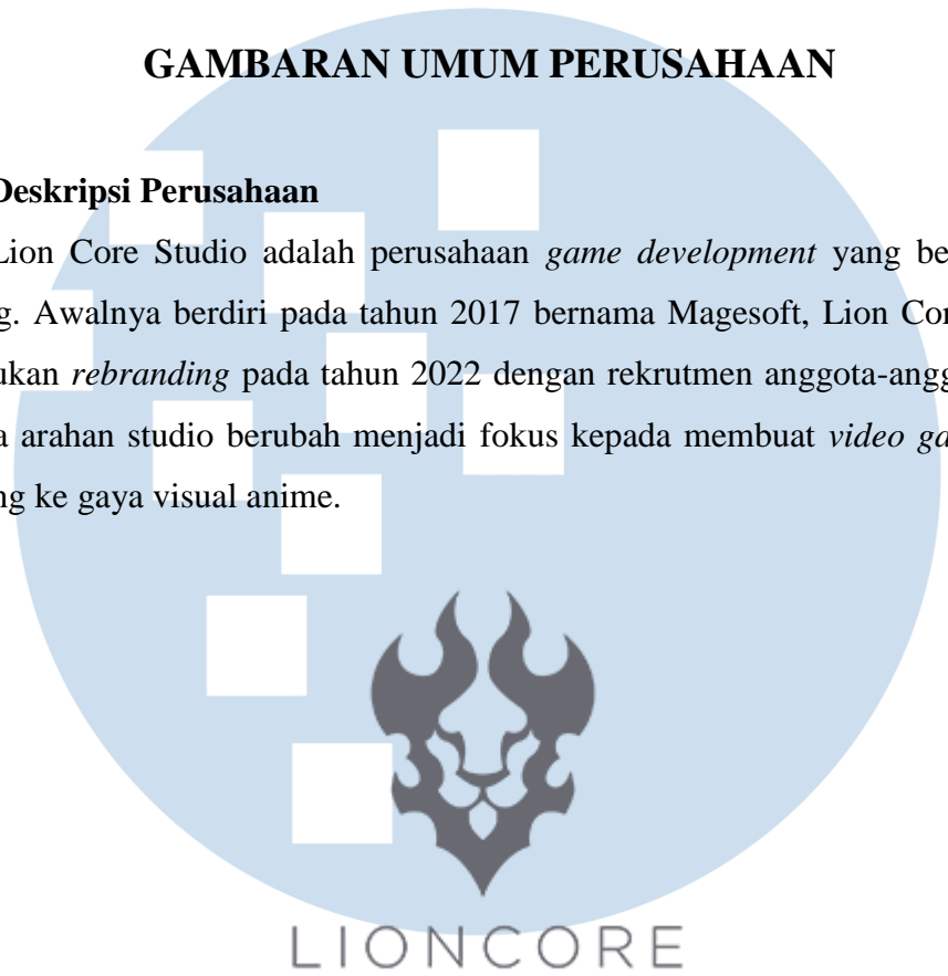
Gambar 2.1 Logo Lion Core

Lion Core Studio adalah perusahaan game development yang berbasis di Malang. Awalnya berdiri pada tahun 2017 bernama Magesoft, Lion Core Studio melakukan rebranding pada tahun 2022 dengan rekrutmen anggota-anggota baru dimana arahan studio berubah menjadi fokus kepada membuat video game yang condong ke gaya visual anime.