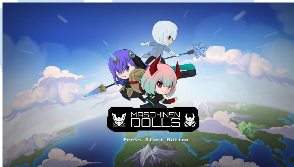
Gambar 2.4 Maschinen Dolls

Game tentang sekelompok action figure yang hidup layaknya manusia biasa serta perjuangan mereka melawan grup mecha . Game tersebut bergenre 2.5D Platformer dengan simulasi kehidupan serta fitur pemilihan karakter serta kostumisasi mereka untuk mencoba berbagai senjata atau teknik yang dapat digunakan saat pertarungan. Game ini direncanakan akan dirilis untuk konsol dan PC.