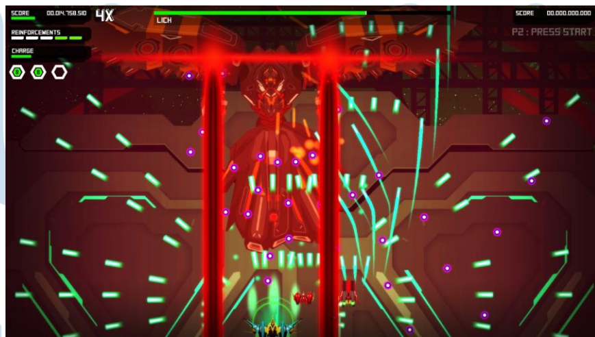
Gambar 2.3 Burst Fighter

Sebuah game dengan genre Arcade Shooter dengan cerita tentang revolusi yang amat tragis. Game ini memiliki 8 level yang dibuat dengan cermat serta menyediakan fitur kostumisasi kapal yang amat banyak. Tersedia di platform game Steam untuk PC.