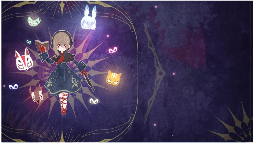
Gambar 2.5 Masquaradious