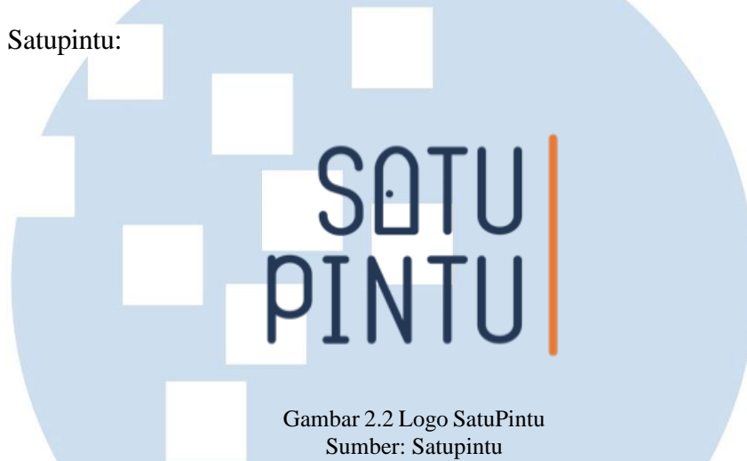
Gambar 2.2 Logo SatuPintu