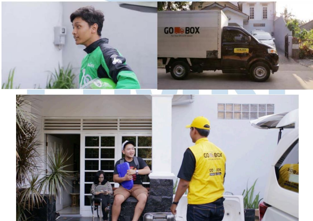
Gambar 2.5 Video Iklan GoBox

Gojek adalah perusahaan teknologi asal Indonesia yang menyediakan layanan berbasis aplikasi untuk berbagai kebutuhan sehari-hari. Awalnya dimulai sebagai layanan transportasi berbasis ojek. Gojek telah berkembang menjadi platform super-app yang menawarkan beragam layanan, seperti pemesanan transportasi, pengiriman makanan dan barang, layanan keuangan, pembayaran online, layanan kesehatan, layanan kecantikan, dan banyak lagi. Pada tahun 2015 disaat fitur GoBox pertamakali hadir pada aplikasi Gojek, Papermotion Pictures diberi tanggungjawab untuk membuat video iklan yang nantinya ditampilkan di YouTube Gojek Indonesia yang berjudul “Go big dengan GO-BOX”. Video Ads ini dirancang untuk mempromosikan secara luas fitur baru Gojek agar dapat mencapai audience. Alasan penulis memilih portofolio dari klien Gojek ini karena klien Gojek karena menjadi klien besar pertama yang bekerja sama dengan Papermotion Pictures setelah setahun berusaha membangun reputasi.