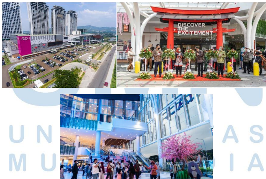
Gambar 2.6 Video Documentation AEON Mall

Aeon Mall menawarkan berbagai macam toko ritel, restoran, bioskop, area hiburan, dan layanan lainnya di dalam kompleksnya. Mereka seringkali menjadi destinasi belanja dan hiburan populer bagi masyarakat setempat dan wisatawan karena menyediakan pengalaman berbelanja yang lengkap dan variasi produk yang luas. Pada tahun 2020, Papermotion Pictures ditugasi membuat video documentation oleh Aeon Mall Sentul. Kumpulan karya video yang dibuat untuk mempromosikan acara pembukaan pusat perbelanjaan AEON Mall di Sentul, Indonesia. Video-video ini bertujuan untuk memberikan gambaran yang menarik dan memikat tentang mall baru tersebut kepada calon pengunjung. Aeon Mall Sentul ini merupakan salah satu klien terbesar yang ditangani oleh Papermotion Pictures di tahun 2020.