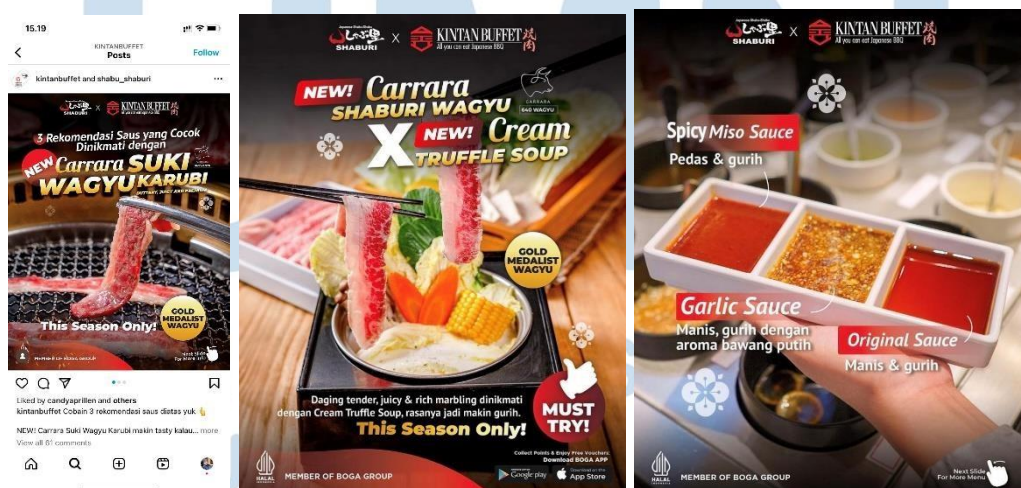
Gambar 2.7 Food Photography Gyu-Kaku

Terakhir, terdapat Klien dari Kintan Buffet. Kintan Buffet adalah sebuah restoran yang menawarkan konsep "all you can eat" yakiniku, para pelanggan dapat menikmati berbagai jenis daging yang dapat dimasak sendiri di atas panggangan di meja mereka. Restoran ini memiliki panggangan di meja masing-masing, memungkinkan para pelanggan untuk memasak daging sesuai dengan preferensi dan selera masing-masing. Kintan Buffet menawarkan berbagai pilihan daging, mulai dari daging sapi, daging ayam, seafood, hingga sayuran, yang kemudian disajikan dalam potongan-potongan kecil dan disiapkan untuk dimasak di atas panggangan di meja masing-masing. Pada proyek ini, Papermotion Pictures ditugaskan membuat Food Photography untuk special event Shaburi x Kintan Buffet yang ditampilkan dan dipromosikan di Instagram dan di Outlet. Dibawah ini merupakan kumpulan karya fotografi yang dibuat untuk mempromosikan merek atau layanan restoran Gyukaku. Fotografi ini bertujuan untuk menarik perhatian, memancing selera, dan mengkomunikasikan pesan yang kuat kepada pelanggan. Penulis memasukkan karya Shaburi x Kintan Buffet ke dalam portofolio karena pengambilan gambar ini berlangsung selama 11 jam oleh tim fotografer yang berdedikasi untuk menghasilkan kualitas terbaik. Hal ini menjadi salah satu foto istimewa yang mendapat perhatian khusus karena merupakan acara yang spesial.