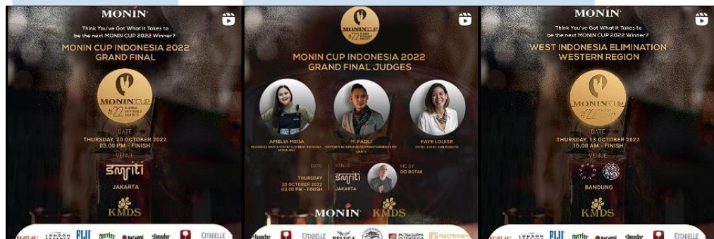
Gambar 2.3.1 Poster Informasi Acara MCCC 2022

merupakan perlombaan yang di adakan PT KMDS untuk memberi kesempatan terhadap barista yang ada di Indonesia untuk menunjukkan kemampuannya melalui perlombaan serta merupakan suatu ajang untuk meningkatkan brand awareness dari brand MONIN, dan telah berjalan rutin di setiap tahunnya.