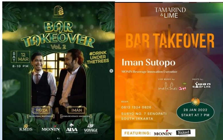
Gambar 2.3.2 Poster Undangan Monin Master