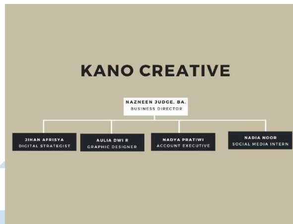
Gambar 2. 1 Bagan Kano Creative Production