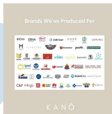
Gambar 2. 5 List klien dari Kano

Sribu merupakan sebuah marketplace penyedia jasa freelancer di Indonesia, menghubungkan antara freelancer dengan kostumer.