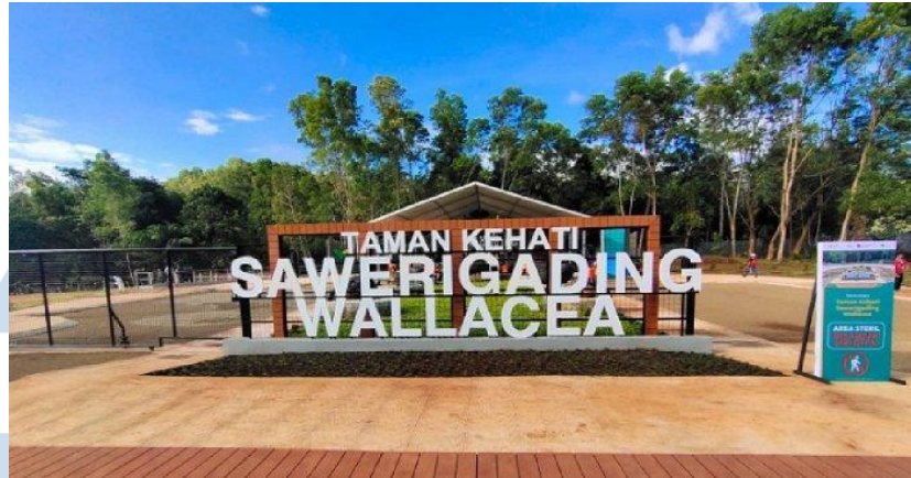
Gambar 2.5 Dokumentasi PT Vale Indonesia Taman Kehati Sawerigading Wallacea

Di taman Kehati memiliki desain enviromtent yang cukup lengkap seperti identification signage yang diletakkan tepat didepan gerbang masuk ke taman, directional yang banyak diletakkan didalam taman untuk membantu pengunjung mengetahui arah, regular and prohibitory juga lengkap karena PT Vale sangat mematuhi standar safety, hingga orientation yang merupakan peta atau denah untuk membantu pengunjung dalam menentukan arah. Di dalam Taman Kehati banyak menyimpan flora dan fauna khas Sulawesi selatan yang langka untuk dilestarikan oleh pihak PT Vale Indonesia agar tidak punah. Selain itu, juga terdapat beberapa kendaraan-kendaraan berat yang biasanya digunakan oleh karyawan PT Vale dalam melakukan pekerjaannya di pabrik.