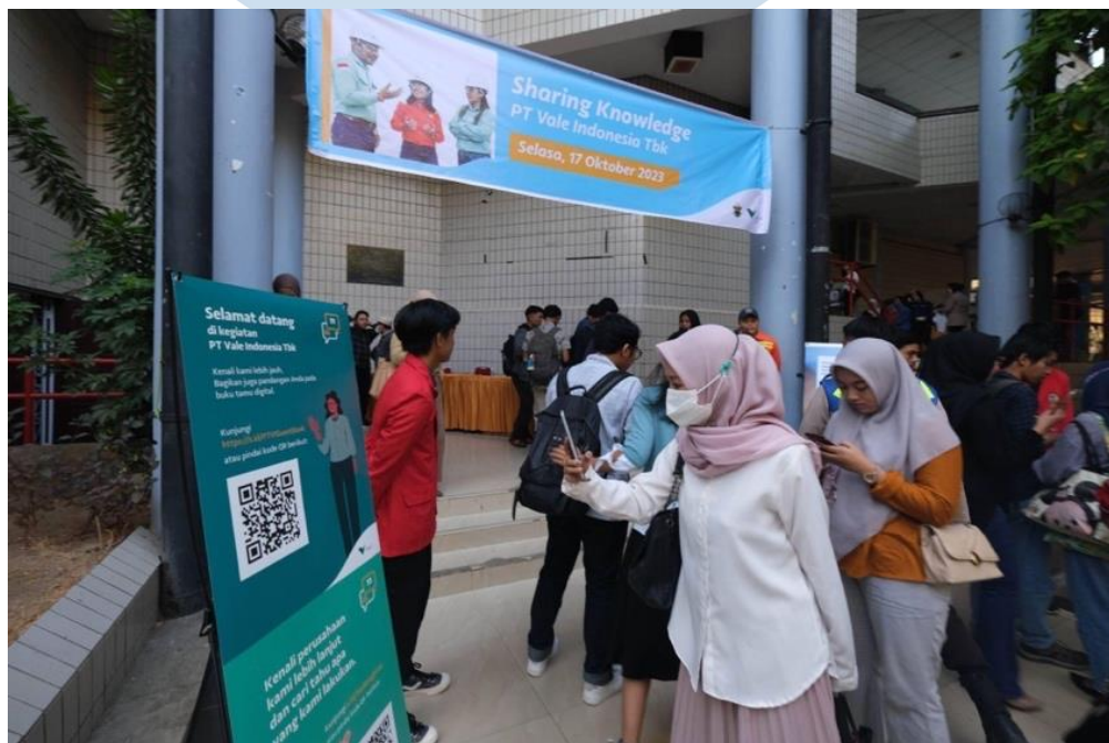
Gambar 2.3 Dokumentasi PT Vale Indonesia dalam Acara Roadshop Sharing Session di UNHAS

Program Sharing Knowledge yang diadakan oleh PT Vale di Baruga Andi Pangerang Pettarani Universitas Hasanuddin (Unhas) merupakan program tindak lanjut dari Memorandum of understanding yang diinisiasi oleh Departemen People and Culture . Kegiatan ini dilakukan untuk memberikan kesempatan bekerja bagi para pemuda–pemudi yang ingin terjun ke dunia pertambangan. Dalam kegiatan tersebut tidak hanya melibatkan perusahaan dan universitas, tetapi juga dihadiri oleh 1.450 mahasiswa dan alumni dari Kampus Sultan Hasanuddin, menciptakan kesempatan bagi mereka untuk mendapatkan wawasan langsung dari praktisi industri.