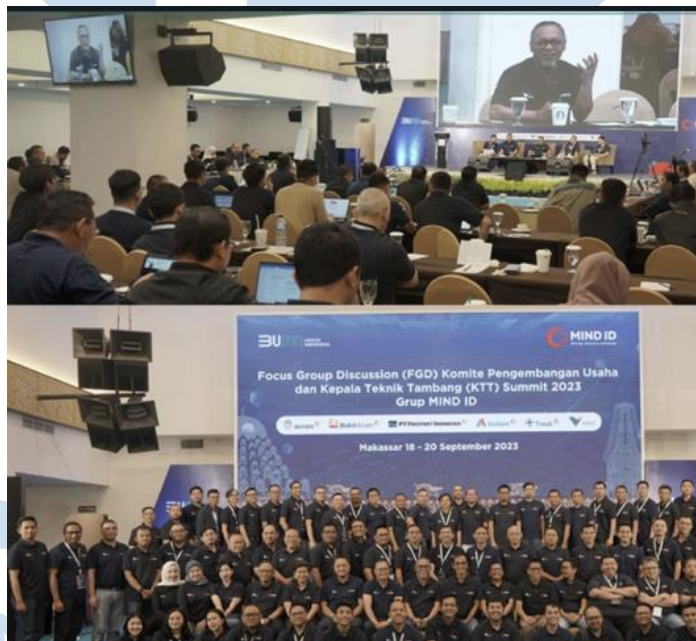
Gambar 2.4 Dokumentasi PT Vale Indonesia dalam Acara FGD Grup MIND ID

Forum Group Discussion (FGD) dalam industri pertambangan Indonesia yang dikelola oleh Mining Industry Indonesia (MIND ID) merupakan suatu acara strategis yang diselenggarakan oleh Badan Usaha Milik Negara (BUMN). Lokasi pelaksanaan acara berada di kota Makassar, Sulawesi Selatan. PT Vale, sebagai tuan rumah, memainkan peran sentral dalam penyelenggaraan pertemuan ini. Acara tersebut dihadiri oleh seluruh entitas anak usaha MIND ID, yakni PT Antam, PT Bukit Asam, PT Freeport Indonesia, PT Inalum, dan PT Timah, yang turut memberikan kontribusi penting dalam industri pertambangan nasional.