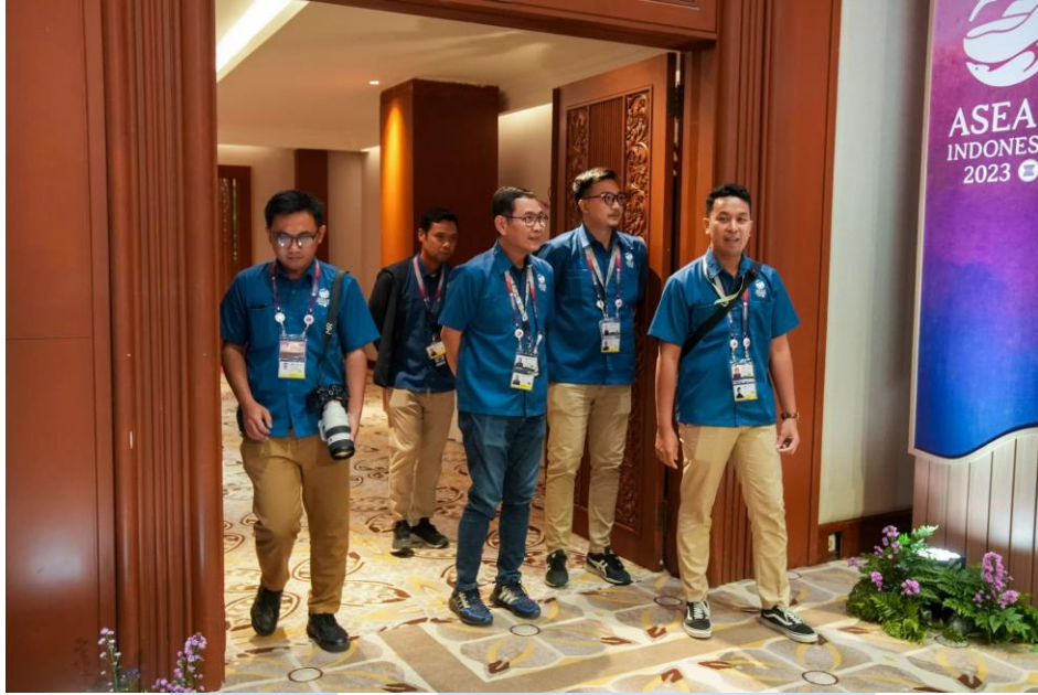
Gambar 2.8 KTT ke 43 ASEAN 2023

Sumber: https://mdmedia.co.id/whats-up/62/berita/persiapan-seatoday-sebagai-host-broadcaster-untuk-ktt-ke-43-asean-2023