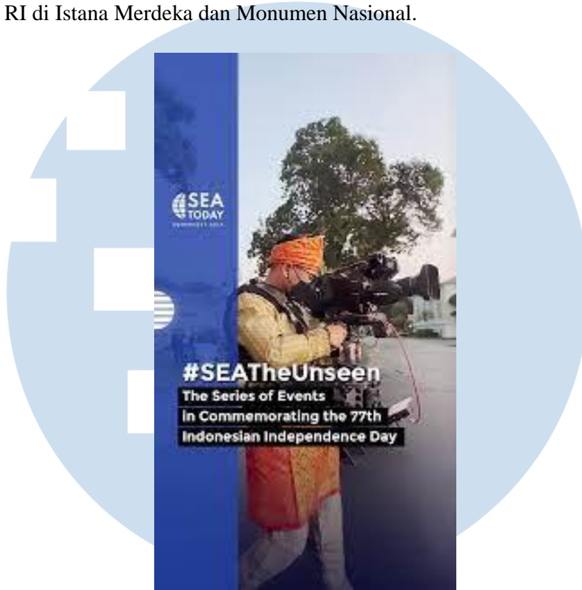
Gambar 2.5 HUT ke-77 RI di Istana Merdeka dan Monumen Nasional.