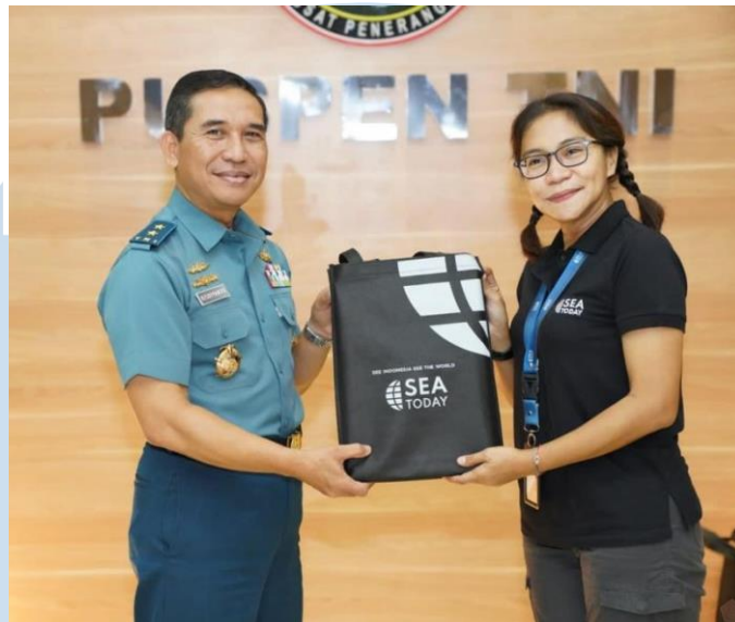
Gambar 2.3 HUT TNI