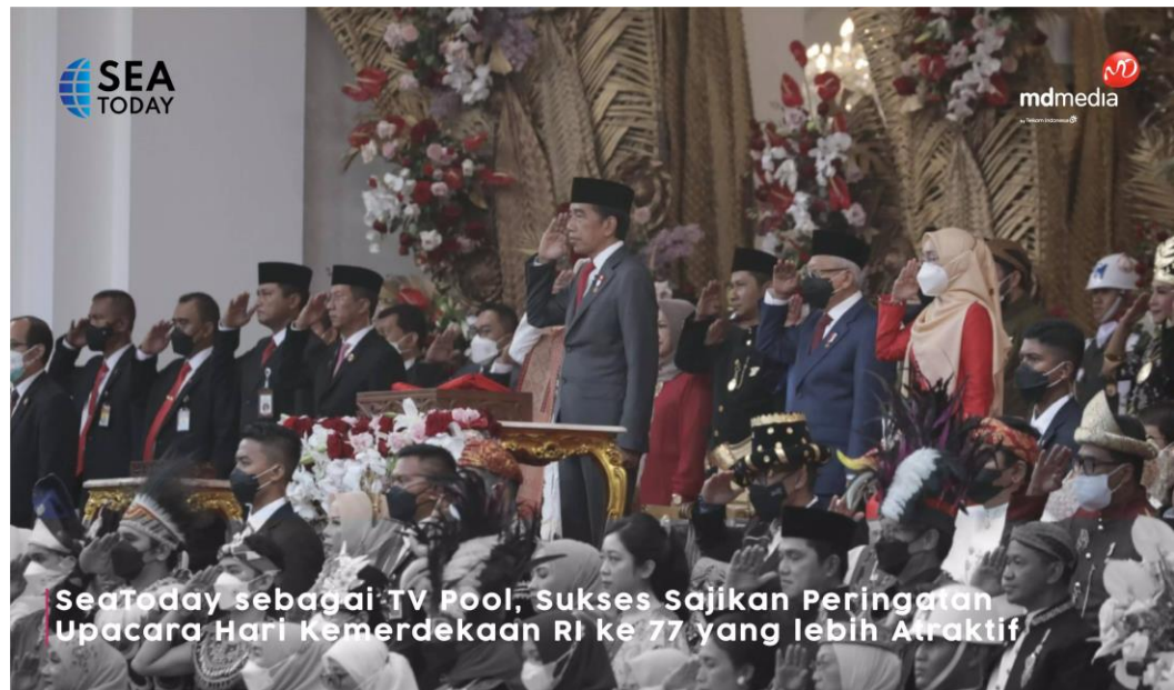
Gambar 2.4 Peringatan Upacara Hari Kemerdekaan RI ke 77 2022