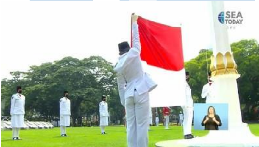
Gambar 2.2 HUT ke-76 RI