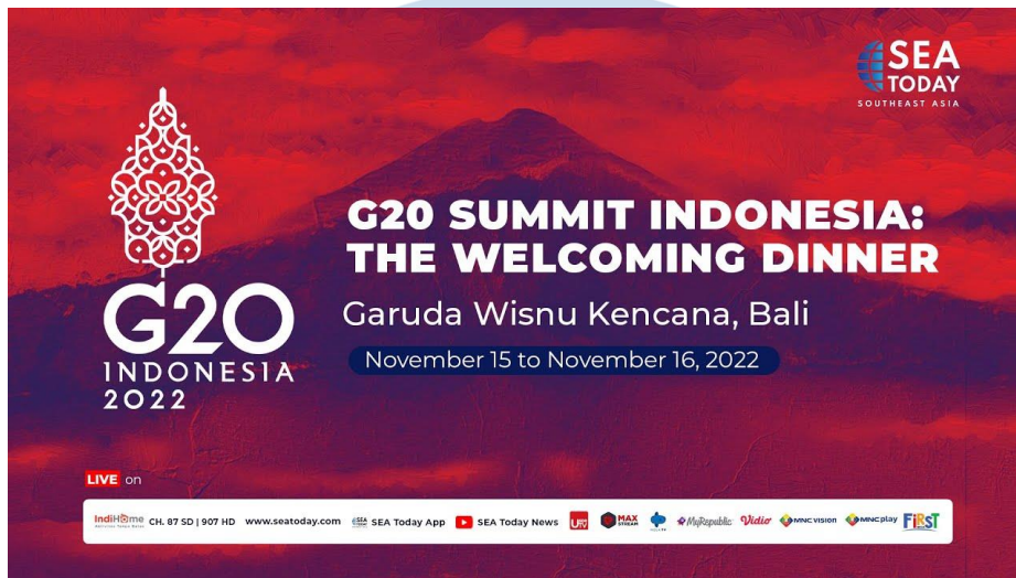
Gambar 2.7 SEAToday G-20

6. SEAToday masuk untuk menjadi TV-pool di G-20.