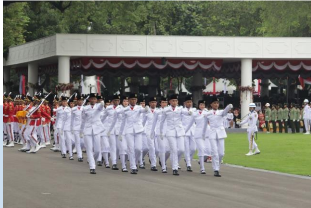
Gambar2.6 SEA Today memberikan tampilan baru baik dari segi kreatif, teknis, dan teknologi