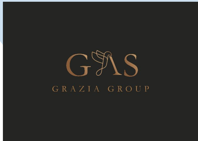
Gambar 2.1 Logo Grazia Group

Grazia Group merupakan sebuah perusahaan yang berfokus pada retail fashion khususnya wedding yang berdiri pada tahun 2018, sebelum Grazia Group berdiri, Grazia Group berawal dari sebuah brand yaitu Noma yang berfokus pada acesories wedding yang kemudian didirikan sebuah perusahaan sebagai induk perusahaan yaitu PT. Grazia Abadi Sejahtera.