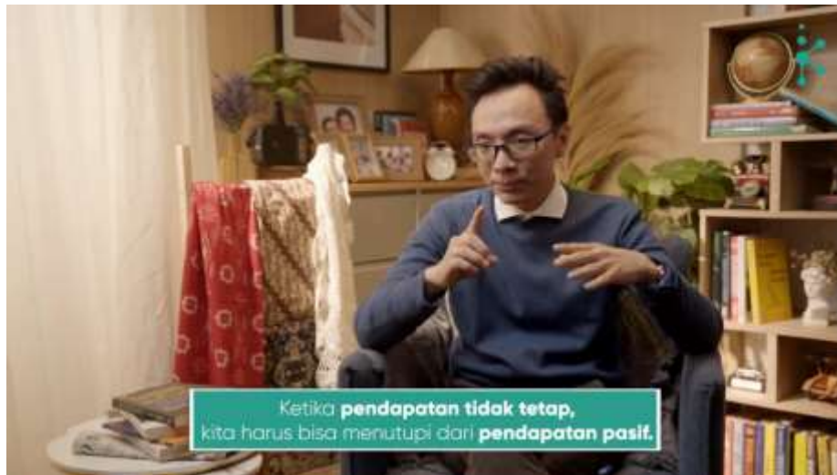
Gambar 3.6 Video Pembelajaran “ Financial Planning ”