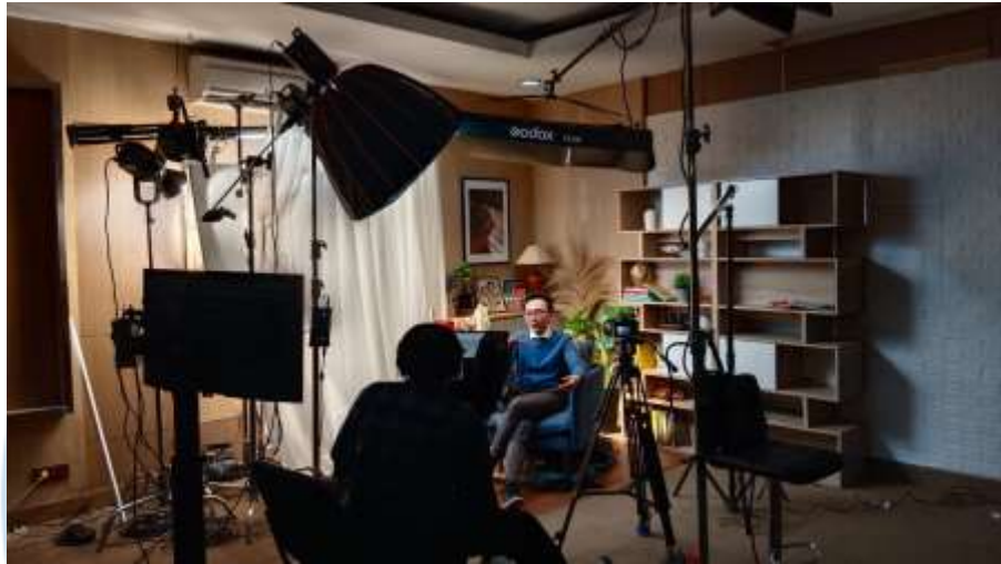
Gambar 3.5 Proses Shooting Course Financial Planning

Setelah tahap produksi selesai, penulis bersama dengan narasumber serta kru lainnya melakukan foto bersama yang dapat dilihat pada lampiran F pada bagian lampiran. Penulis juga mengunggah file dari kedua kamera ke Google Drive untuk diserahkan kepada editor. Pada tahap pasca-produksi penulis sebagai videografer hanya mengawasi tone dan mood warna agar sesuai dengan deck yang sudah dibuat. Hasil akhir dari video pembelajaran ini akan ada di platform Kognisi.Id seperti pada Gambar 3.6.