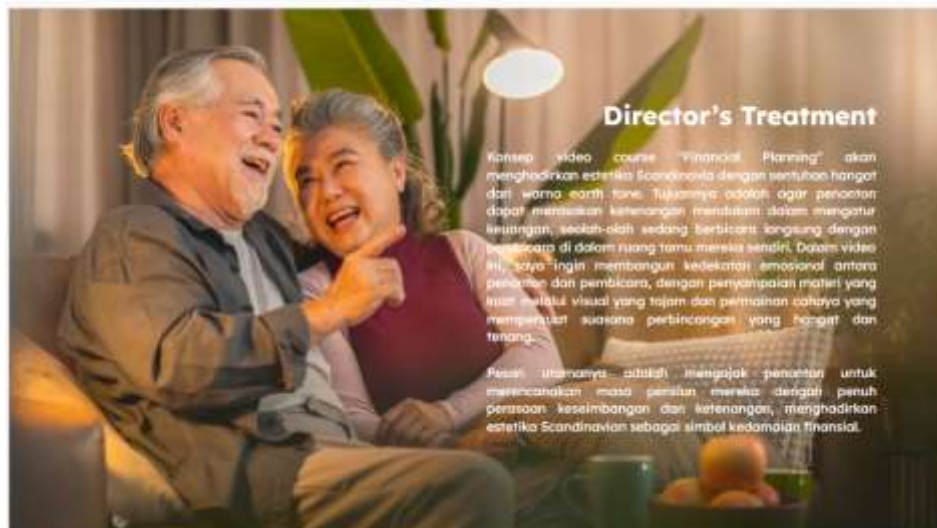
Gambar 3.2 Director Treatment Course Financial Planning

Pada tahap pra-produksi pertama-tama penulis sebagai videografer akan membahas creative deck yang telah dibuat sutradara seperti Gambar 3.2 terkait mood , warna, lokasi, dan treatment yang akan digunakan. Mood dan warna yang akan digunakan dominan warm yang dapat menciptakan suasana hangat di hari tua. Lokasi yang dipilih merupakan ruangan Jupiter yang akan diubah menjadi ruangan yang nyaman dan seperti ruang tamu rumah orang yang sudah berada di hari tua. Treatment kamera yang digunakan untuk video pembelajaran ini adalah dua kamera still dan ada beberapa shot b-rolls dan insert shot properti di ruangan. Setelah membahas creative deck dengan sutradara penulis akan membuat rancangan visual berdasarkan creative deck yang telah dibuat.