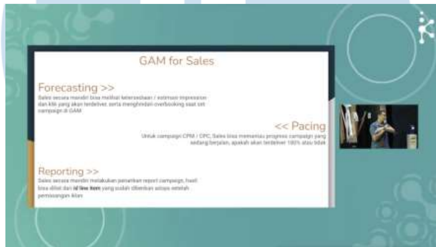
Gambar 3.7 Video Pembelajaran Hybrid seminar “ Technical Refreshment: Google Ads Manager dan DFP ”

seminar secara offline maupun online . Nantinya rekaman tersebut akan diberikan kepada editor untuk dipotong dan disambung menjadi satu video utuh berisikan materi yang telah disampaikan oleh SME. Tangkapan layar dari video hybrid seminar ada pada Gambar 3.7. Hasil akhir dari video hybrid seminar akan diunggah ke Learning Management System (LMS) Kompas Gramedia agar dapat diakses oleh seluruh karyawan Kompas Gramedia.