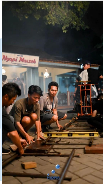
Gambar 3.2.2.2 Penulis Sedang mempersiapkan dolly kamera

Ketika penulis bergabung dengan tim lighting, penulis bertanggung jawab untuk membantu gaffer dengan mempersiapkan alat-alat yang dibutuhkan ketika telah sampai di lokasi syuting. Penulis mempersiapkan dan merapikan berbagai macam lampu, kabel, dan support equipment . Penulis mengikuti arahan dari gaffer untuk melakukan set-up lampu yang sesuai dengan permintaan dari gaffer secara langsung. Penulis juga melakukan set-up aksesoris lampu seperti cutter light , polly , kain silk , kain black , ultrabounce dan lain sebagainya.