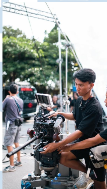
Gambar 3.2.2.1 Penulis Sedang mempersiapkan kamera dari arahan Bapak Petir

untuk membantu asisten kamera satu dan Dop secara langsung dengan segala kebutuhannya. Penulis akan mempersiapkan segala peralatan asisten kamera satu ketika sebelum memulai syuting dan membantu guard kamera dalam merakit kamera di lokasi syuting. Penulis juga akan mencatat segala perubahan kamera yang ada dan disimpan untuk keperluan frame yang akan datang. Penulis juga berkomunikasi kepada divisi lain seperti grip kamera dan gaffer terkait perpindahan frame maupun jika ada request khusus dari Dop secara langsung. Di tengah-tengah syuting tentunya juga penulis akan membantu asisten kamera satu untuk mengganti lensa ataupun mengganti filter kamera yang dibutuhkan.