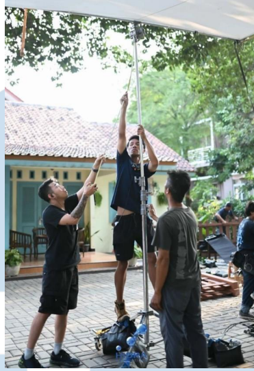
Gambar 3.2.2.3 Persiapan syuting bersama dengan tim lighting