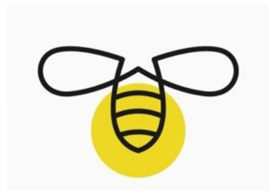
Gambar 2. 1 Logo Perusahaan Fireflies Audio Post