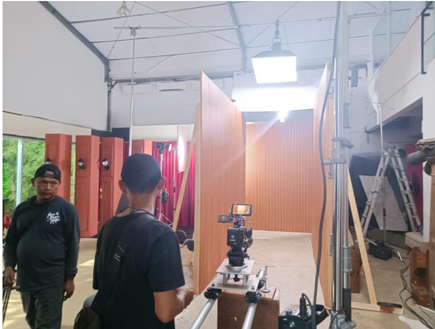
Studio Indoor A