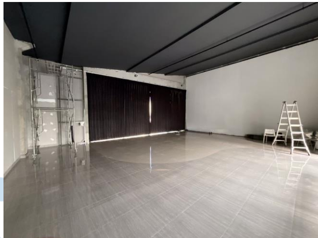
Sumber Studio Indoor D : Dokumentasi pribadi dari penulis