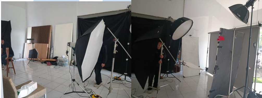
Studio Indoor C