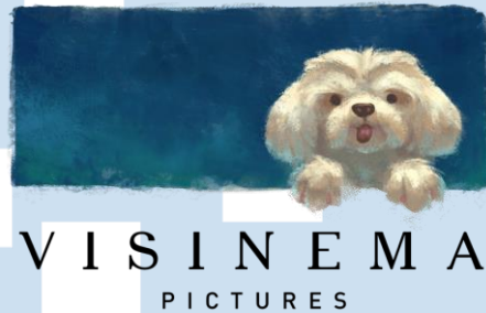
Gambar 2.1 Logo Visinema Pictures

Visinema Pictures merupakan salah satu rumah produksi film terbesar di Indonesia yang telah berdiri sejak 2008. Saat ini Visinema group memiliki beberapa bagian yang terdiri dari Visinema pictures, Skriptura, Visinema Content, Visinema studios dan juga Bioskop Online. Production house yang telah berdiri lebih dari satu dekade ini didirikan oleh Angga Dwimas Sasongko, salah satu sutradara ternama Indonesia.