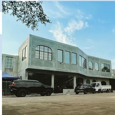
Gambar 2.1 Gedung Perusahaan