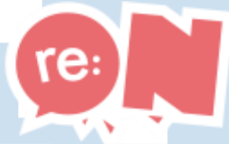
Gambar 2.1 Logo re:ON Comics

PT. Wahana Inspirasi Nusantara, atau yang lebih biasa dikenal dengan re:ON Comics, merupakan sebuah perusahaan komik Indonesia yang menerbitkan komik kompilasi karya-karya komikus lokal yang diterbitkan setiap enam minggu sekali. Berdasarkan informasi yang diambil dari Licensing Manager atau supervisor magang, re:ON Comics pertama kali didirikan pada tahun 2013 oleh Christiawan Lie, Andik Prayogo, dan Yudha Negara dengan tujuan untuk menghidupkan kembali komik Indonesia. Hal ini yang menjadi latar belakang nama perusahaan ini yang di mana 're' berarti kembali, serta 'on' yang berarti menghidupkan. Majalah kompilasi komik pertama diterbitkan pada bulan Juli 2013, yang mengumumkan tiga komik karya komikus lokal pertama mereka yang berjudul The Grand Legend: Ramayana , Chrysalis dan Me vs Big Slacker Baby (Kusumanto, 2015).