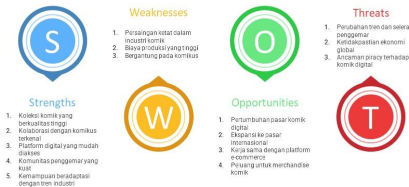
Gambar 2.3 SWOT re:ON Comics

Hasil analisis S.W.O.T ini didapatkan melalui dokumentasi pribadi dengan bantuan informasi yang telah diberikan oleh Fachreza Octavio, Licensing Manager atau supervisor magang. Dari hasil analisis S.W.O.T re:ON Comics yang penulis buat, dapat disimpulkan bahwa re:ON Comics memiliki kekuatan dalam kualitas komik dan kolaborasi dengan komikus-komikus lokal yang terkenal, serta peluang dalam pertumbuhan pasar digital dan ekspansi internasional. Di sisi lain, mereka menghadapi persaingan ketat dan biaya produksi yang tinggi sebagai kelemahan, dengan ancaman piracy dan perubahan trend sebagai risiko utama.