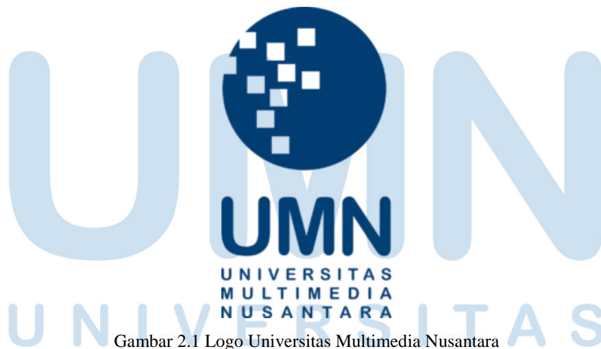
Gambar 2.1 Logo Universitas Multimedia Nusantara

UMN terdiri dari 4 fakultas yaitu Fakultas Seni dan Desain, Fakultas Informasi dan Teknologi, Fakultas Ilmu Komunikasi dan Fakultas Ekonomi. Dalam Fakultas Seni dan Desain (FSD) UMN pada tahun 2016 terbagi menjadi tiga Program Studi (Prodi) yaitu, Prodi Desain Komunikasi Visual (DKV), Film dan televisi (FTV), dan Arsitektur. FSD UMN menyediakan teknologi, peralatan dan kurikulum terkini dan lengkap untuk mendorong dan mengekspresikan kreativitas dan menciptakan desain yang membantu memecahkan masalah sosial dalam perubahan global.