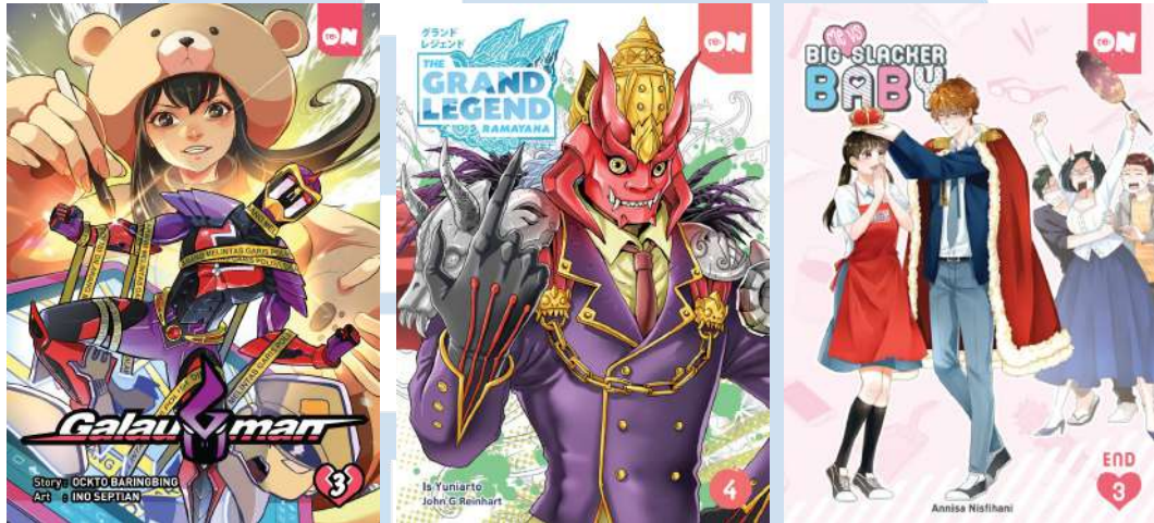
Gambar 2.1, 2.2, dan 2.3. (dari kiri) Komik Galauman , The Grand Legend: Ramayana , dan Me vs Big Slacker Baby

Desember 2016, sudah ada 24 volume yang diterbitkan. Dari semua proyek yang telah diterbitkan, ada beberapa yang cukup dikenal dan mendapatkan sambutan baik dari pembaca, yaitu The Grand Legend: Ramayana , Galauman , dan Me vs Big Slacker Baby . Komik serial Me vs Big Slacker Baby bahkan sudah diterbitkan di Jepang, dan telah mendapatkan adaptasi film live-action .