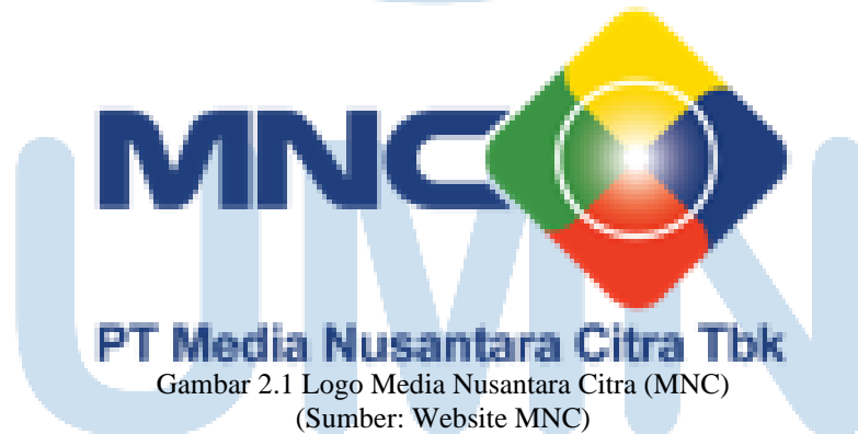
Gambar 2.1 Logo Media Nusantara Citra (MNC)

Sekarang Media Nusantara Citra (MNC) mempunyai empat stasiun televisi yaitu; MNC TV, GTV, iNews, dan RCTI. Media Nusantara Citra (MNC) mulai menyebar ke media lainnya seperti portal berita digital dan juga radio. Beberapa nama portal berita digital dan radio yang berada di bawah kendali MNC yakni; iNews.id, IDXChannel.com, Celebrities.id, Sportstars.id, Sindonews.com, Okezone.com, BuddyKu, MNCTrijaya.com, dan Trijaya FM.