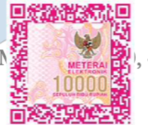
( Cordelia Laras Pramudito )