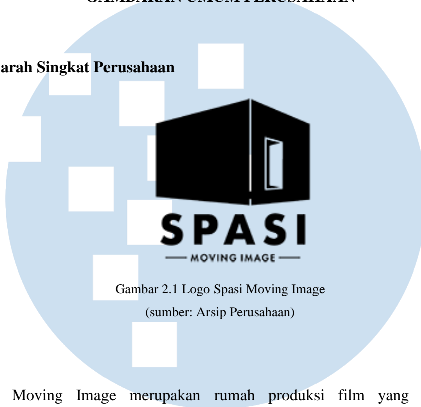
Gambar 2.1 Logo Spasi Moving Image

SPASI Moving Image merupakan rumah produksi film yang menjamin keberlanjutan dengan mengembangkan cerita dan memproduksi film yang unik dan menarik. Saat ini, SPASI Moving Image sedang fokus mengembangkan ide cerita untuk menghasilkan film serial dan film layar lebar. Kantor SPASI Moving Image berlokasi di Jl.Sarpa No.4, RT.7/RW.1, Siganjur, Kec. Jagakarsa, Kota Jakarta Selatan. Salah satu karya dari Spasi Moving Image adalah miniseri bertajuk “Sementara, Selamanya” (2020). Miniseri tersebut dibintangi dan disutradarai oleh Reza Rahadian. Selain itu, beberapa film pendek dan serial oleh SPASI Moving Image yaitu “Write Me A Love Song” (2021), “Bad Boys vs Crazy Girls” (2022), “Wongasu” (2022).