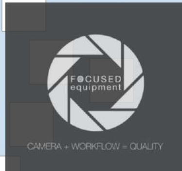
Gambar 2.1. Logo FOCUSED Equipment

PT. Griya Fokus Sinema atau lebih dikenal dengan FOCUSED Equipment merupakan perusahaan yang bergerak pada bidang penyewaan rental dan jasa alat sinema sejak Januari 2009. FOCUSED saat ini telah memiliki dua cabang yang terletak di Jakarta dan Yogyakarta, alasan pemilihan dua kota tersebut dikarenakan keduanya merupakan kota yang memiliki potensi besar terhadap industri kreatif khususnya pada industri film.