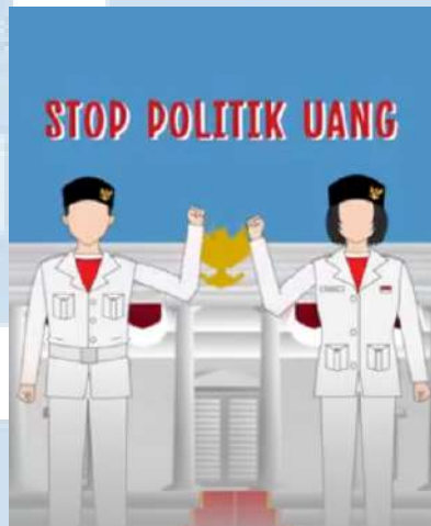
Gambar 3.2.2.1 Stop politik uang (sumber : media sosial TVRI)

Penulis harus mengerjakan reivisi setelah hasil vidio campaign dilakukan pengecekan oleh supervisor . Revisi dikerjakan selama kurang lebih sehari, dan hasilnya diberikan kembali kepada supervisi untuk dicek kembali dan dikonfirmasi untuk layak publish . campaign ini bertujuan untuk memberikan edukasi kepada masyarakat.