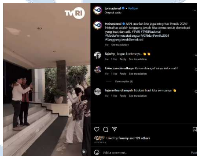
Gambar 3.2.2.3 Konten TVRI