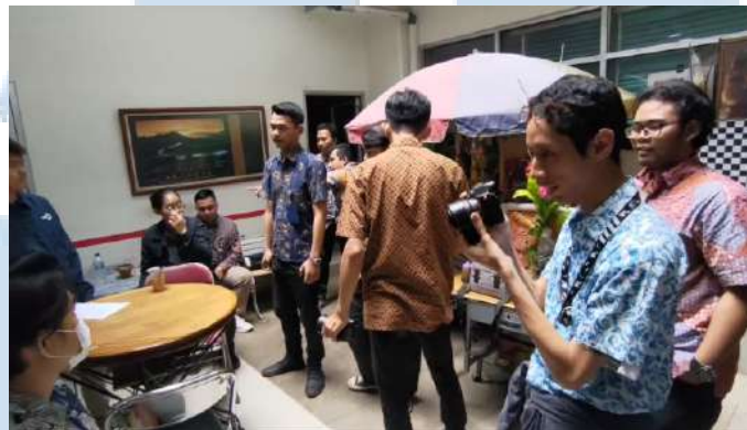
Gambar 3.2.2.2 proses syuting

Penulis juga ikut andil dalam proses syuting untuk content video media sosial. Penulis ikut melakukan proses syuting di set dan mempelajari hal-hal yang penting untuk diri penulis.