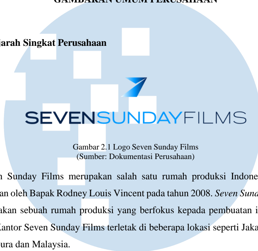
Gambar 2.1 Logo Seven Sunday Films

Seven Sunday Films merupakan salah satu rumah produksi Indonesia yang didirikan oleh Bapak Rodney Louis Vincent pada tahun 2008. Seven Sunday Films merupakan sebuah rumah produksi yang berfokus kepada pembuatan iklan dan film. Kantor Seven Sunday Films terletak di beberapa lokasi seperti Jakarta, Bali, Singapura dan Malaysia.